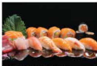
159. SUSHI E SASHIMI PICCOLO € 20,00 9 sashimi 5 nighiri 3 hossomaki 4 uramaki