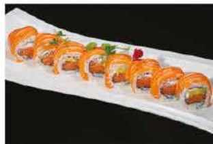
82. SALMON OUT € 12,00 avocado, philadelphia avvolto da salmone esterno