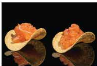
401. CHIPS SAKE € 4,00 tritato di salmone piccante, maionese, tobico, salsa teriyaki, philadelphia e chips