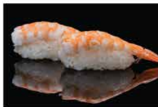
119. NIGHIRI EBI € 4,00 gambero* cotto