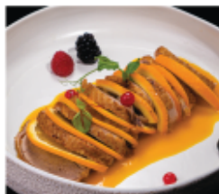
212. ANATRA ALL'ARANCIA € 10,00