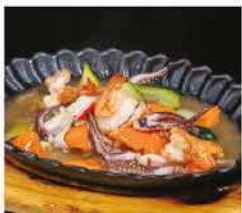
229. FRUTTI DI MARE* CON VERDURE ALLA PIASTRA € 10,00