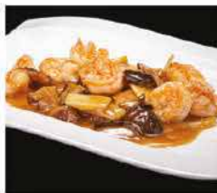
204. GAMBERI* CON FUNGHI E BAMBU € 8,00