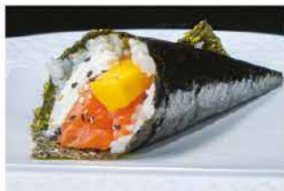
53. TEMAKI MANGO € 4,00 salmone, mango e philadelphia