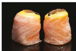
145. GUNKAN FRABEM TARTUFO € 6,00 pallina di riso avvolto con salmone scottato, crunch, salsa tartufo, maionese e salsa zafferano