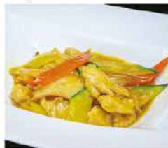
199. POLLO AL CURRY € 6,00