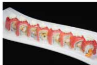
101. DRAGON SPECIALE € 12,00 tempura di gamberi*, avvolto con tonno e philadelphia