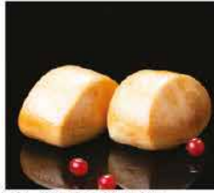
18. PANE FRITTO GIAPPONESE* 2PZ € 3,00 pane bianco fritto