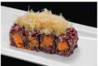
102. SPICY SALMONE VENERE € 12,00 tritato di salmone piccante e pasta kataifi

ROTOLO CON RISO VENERE CREATIVO DELLO CHEF 8 PZ