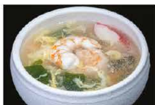
40. ZUPPA DI MARE € 4,00 zuppa di pesce misto, uova e alghe