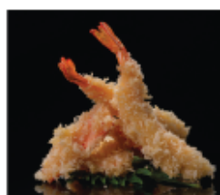
214. TEMPURA DI GAMBERI* E VERDURE € 10,00