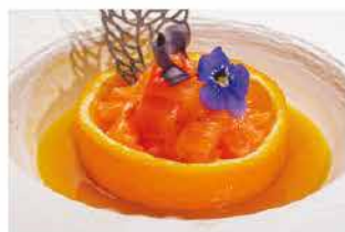
310. TARTAR SALMONE ALL'ARANCIA € 10,00

uova, tabasco, avocado, tempura shiso, foglie fritto di cipolloti, polvere di olive nero e ikura