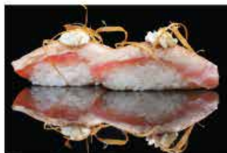
125. TONNO STILY € 5,00 tonno alla fiamma, philadelphia, pasta kataifi e salsa teriyaki