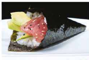
50. TEMAKI MAGURO € 4,00 tonno e avocado