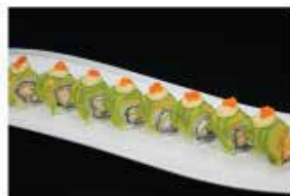
92. DRAGON € 12,00 gamberi* fritti e philadelphia avvolto con avocado