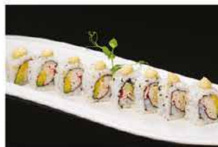
74. CALIFORNIA € 8,00 granchio*, avocado e maionese