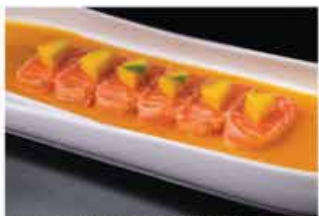
160. CARPACCIO PASSION FRUIT € 12,00 carpaccio di salmone con mango e salsa mango