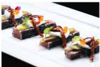
318. MAGURO TATAKI SPECIALI € 12,00 tonno scottato, pomodoro secco, cetrioli all' aceto, burrata, ikura, salsa bbq e salsa wasabi