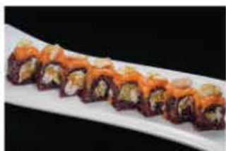
106. EBI MANDORLE € 12,00 fiore di zucca, gamberi* cotti, salmone esterno mandorle e salsa rucola