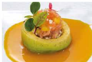
308. KANPAI STILE € 10,00

philadelphia, salmone, salsa avocado, ikura e salsa mango