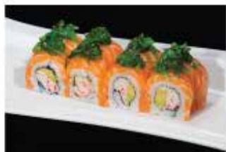
84. BENNY € 12,00 granchio*, philadelphia, avocado, avvolto con salmone e alghe piccante