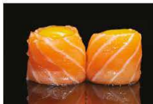
143. GUNKAN QUAGLIA € 6,00 pallina di riso avvolto salmone e uova di quaglia