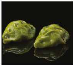
27. RAVIOLI DI VERDURE* 3PZ € 3,00 verdure