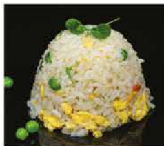
172. RISO CON VERDURE € 6,00 riso bianco saltato con uova e verdure