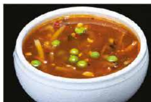
39. ZUPPA AGRO-PICCANTE € 4,00 uova, germogli di soia, verdure, gamberi* e funghi