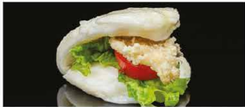
29. BAO CON POLLO € 4,00 pane ripieno con insalata, pomodoro, pollo fritto e salsa rosa