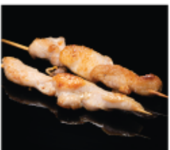
219. SPIEDINI DI POLLO 2PZ € 6,00