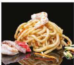
187. PASTE GIAPPONESI DI RISO CON MARE* € 10,00