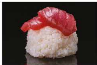
167. CHIRASHI MAGURO € 12,00 tonno