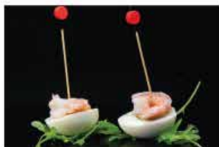
409. UOVA SODE € 6,00 uova, gamberi* e salsa