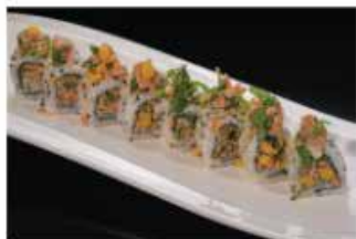
96. TONNO COTTO € 10,00 tonno cotto, polpa di granchio*, rucola e maionese