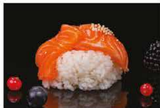
166. CHIRASHI SAKE € 10,00 salmon