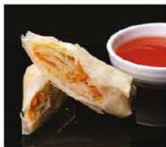
1. INVOLTINO PRIMAVERA* 1PZ € 2,00 involtino di verdure