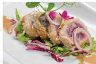
317. KANPAI MAGURO STILY € 12,00 tonno impanato fritto, insalata mista e salsa sesamo