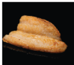
224. PESCE BIANCO ALLA GRIGLIA € 6,00