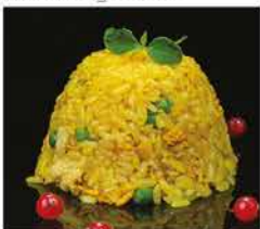
178. RISO CON POLLO AL CURRY € 8,00 riso bianco saltato con uova, pollo e curry