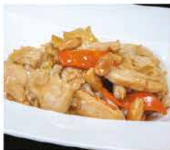
198. POLLO ALLE MANDORLE € 6,00