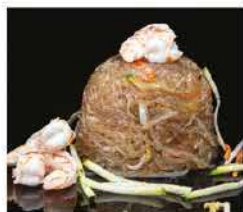
184. SPAGHETTI DI SOIA CON GAMBERI* E VERDURE € 8,00