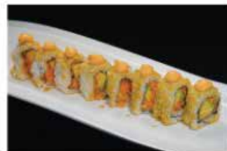
100. MEXICAN ROLL € 12,00 tartare di salmone, avocado, tortilla, maionese piccante