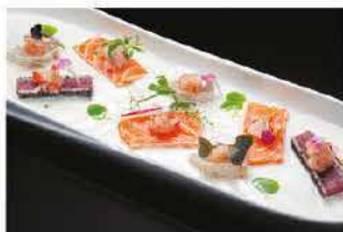
301. CARPACCIO DI YOGURT € 12,00

philadelphia, capesante, tritati di salmone piccante, tempura shiso tempura di rucola e salsa lime