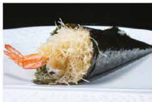
52. TEMAKI EBITEN € 4,00 gambero* fritto e avocado