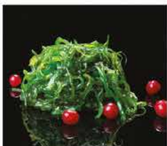
16. GOMA WAKAME* € 5,00 alghe verde piccante