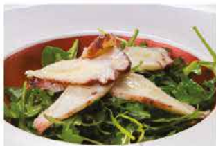
35. INSALATA POLIPO* E RUCOLA € 8,00