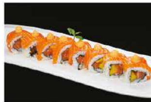
83. MANGO CHILI € 12,00 salmone, mango, salmone esterno mayo salsa spicy e salsa teriyaki