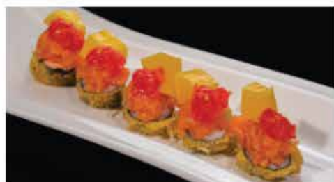
70. HOSOMAKI ESOTIC € 8,00 rotolino fritto con salmone, crunch, maionese, mango, pomodoro e salsa di frutta esotica