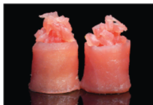
136. GUNKAN GIO TUNA € 6,00 pallina di riso avvolto con tonno e spicy tonno