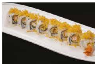
77. EBITEN € 8,00 gamberi* fritti e patate fritte