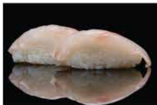
118. NIGHIRI SUZUKI € 3,00 branzino