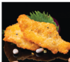
217. POLLO FRITTO € 8,00