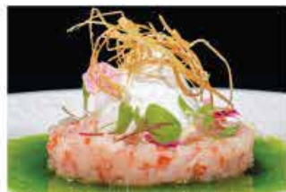
312. TARTAR GAMBERI AL BUFALA € 12,00 gamberi* crudi, pomodori, olio di oliva, bufala, salsa rucola e fritto di cipollotti