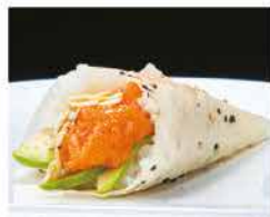
57. TEMAKI SPICY SALMONE PLUS € 5,00 mandorle, avocado e spicy salmon