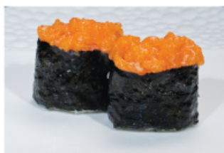
129. GUNKAN SPICY SALMON € 4,00 pallina di riso con salmone, tabasco, maionese e tobiko