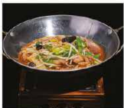
230. SCODELLA DI FUOCO DI MANZO PICCANTE € 10,00 funghi, cipollotti, germogli di soia, peperoni piccante e manzo