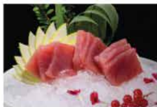
155. SASHIMI MAGURO € 12,00 tonno 9 fette