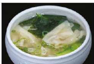
41. ZUPPA DI WANTON € 4,00 ravioli di carne sottili, verdure e cipollotti