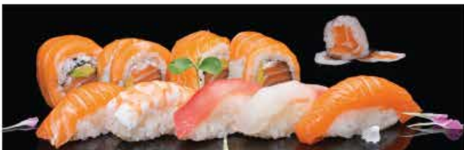
128. SUSHI MISTO 12PZ € 12,00 5 nigiri 3 hosomaki 4 uramaki