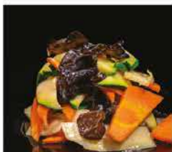
237. VERDURE MISTE SALTATE € 6,00