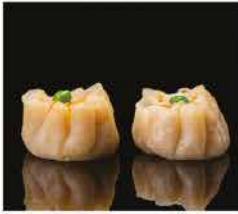
22. RAVIOLI DI GAMBERI* 3PZ € 3,00 gamberi, carne e verdure