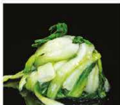
236. XIAO BAI CAI SALTATO € 6,00