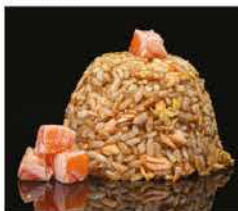
176. RISO SALTATO CON SALMONE € 8,00 riso bianco saltato con uova, salmone e salsa soia