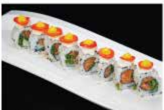
94. MALIBU ROLL € 12,00 salmone, rucola, philadelphia, insalata, pomodoro e salsa zafferano