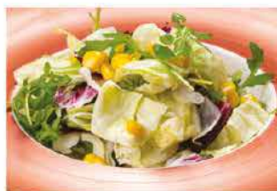
33. INSALATA MISTA € 5,00 insalata mista e mais