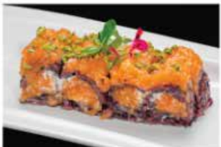
103. SALMONE PISTACCHIO € 12,00 tartare di salmone, philadelphia, pistacchio e salsa rucola