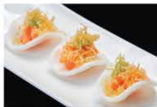
402. CHIPS DI DRAGON € 6,00 salmone piccante avocado patate fritto salsa teriyaki