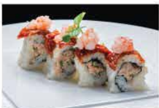
322. FUSION ROLL € 12,00 tonno cotto, mais, rucola, philadelphia, pomodoro secco e gambero* crudo