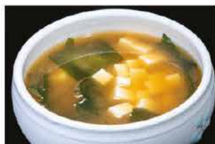
37. ZUPPA DI MISO € 4,00 zuppa di soia, tofu e alghe