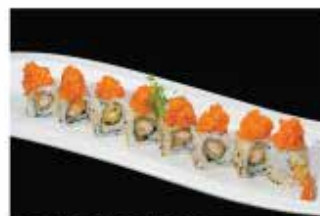
87. EXOTIC € 12,00 gamberi* fritti guarnito con tartar di salmone piccante