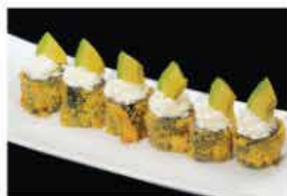
68. HOSOMAKI FRITTO AVOCADO € 8,00 salmone, philadelphia e avocado