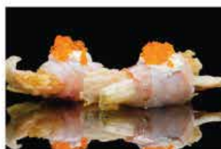
411. INVOLTINO FIOR BRANZINO € 5,00 tempura di fiore di zucca avvolto con carpaccio di branzino