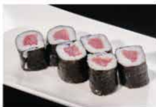
62. HOSOMAKI TEKKA € 5,00 tonno