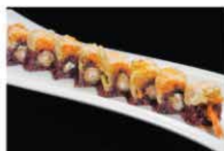
109. EBI FLO € 12,00 gamberoni* in tempura, philadelphia, tartare di salmone, fiore di zucca e salsa teriyaki