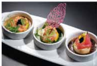
313. TARTAR MISTO SPECIALE € 12,00 salmone, salsa avocado, uova di perut nera o bianca, salsa sesamo, gamberi* rossi, salsa rucola, burrata, foglie d'oro, tonno, tofu, salsa xo, tartufo, bottarga di muggine e salsa wasabi