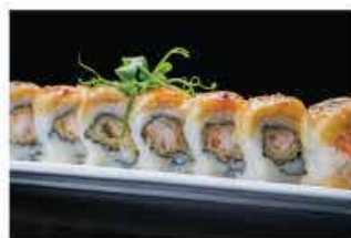
323. BANANA ROLL € 10,00 banana, zucchero di canna e tempura di gamberi*