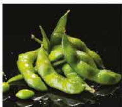
15. EDAMAME* € 4,00 fagioli di soia lessi e sale