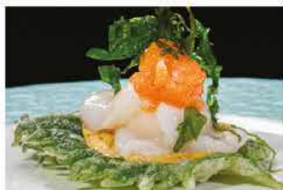
300. BISCOTTI AL CAPESANTE € 12,00

philadelphia, capesante, tritati di salmone piccante, tempura shiso tempura di rucola e salsa lime