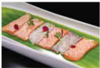
163. CARPACCIO MISTO SCOTTATO € 12,00 pesce misto scottato in salsa rucola