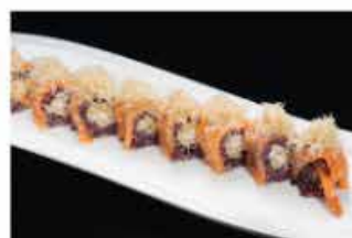
108. URAMAKI TIGER KATAIFI € 12,00 gamberi* fritti, philadelphia, salmone e pasta kataifi