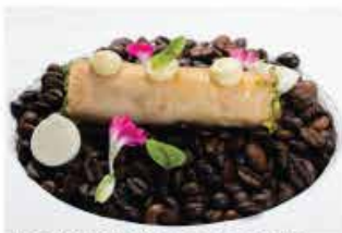
407. INVOLTINO DI TONNO COTTO € 6,00 tonno cotto pistachio salsa lime mozzarella