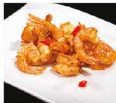
205. GAMBERI* CON SALE PEPE € 8,00