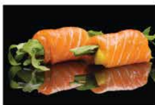
410. INVOLTINI SALMONE MANGO € 5,00 involtino di salmone con rucola e mango