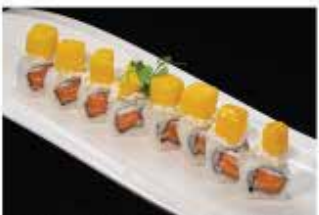
95. PHILADELPHIA E MANGO € 12,00 salmone, philadelphia e mango