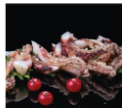
218. CIUFFETTI DI POLIPO* PICCANTI € 8,00