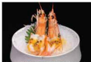
158. SCAMPI PASSION FRUIT 4PZ € 12,00 scampi* con salsa frutta della passione