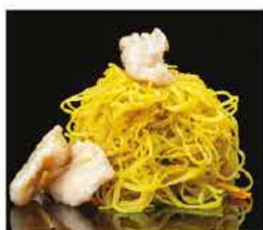
182. SPAGHETTI DI RISO CON POLLO AL CURRY € 8,00