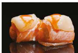
146. GUNKAN CAPESANTE € 6,00 gamberi* fritto avvolto con salmone alla fiamma, capesante, tobiko e salsa piccante