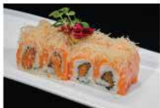
85. CRAZY SALMONE € 12,00 spicy salmone interno, avvolto da salmone scottato e kataifi esterno