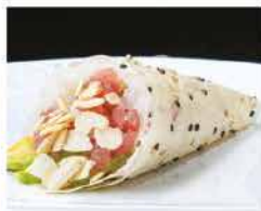
58. TEMAKI SPICY TUNA PLUS € 5,00 mandorle, avocado e spicy tuna