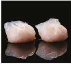
23. RAVIOLI DI GAMBERI TRASPARENTI* 3PZ € 3,00 gamberi e cipolle