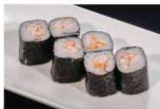
63. HOSOMAKI EBI € 4,00 gambero* cotto