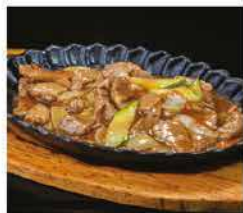
226. MANZO CON VERDURE ALLA PIASTRA € 8,00