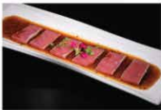
165. TUNA SCOTTATO € 10,00 tonno scottato con salsa wasabi