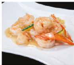
202. GAMBERI* CON VERDURE MISTE € 8,00