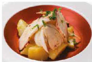
34. INSALATA DI POLIPO E PATATE € 8,00 patate* lessi con polipo e prezzemoli