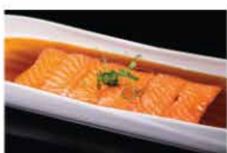
161. CARPACCIO SAKE € 10,00 salmone