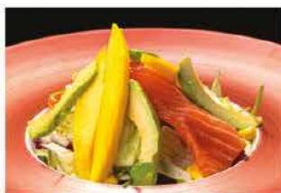
32. INSALATA MISTO SPECIALE € 6,00 insalata, mango, pesce misto, pomodorini e salsa insalata (sesamo e philadelphia)