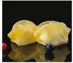
24. RAVIOLI DI MERLUCCIO* 3PZ € 3,00 pesce bianco e gamberi