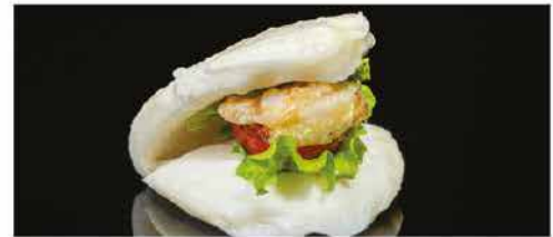
30. BAO CON GAMBERI € 4,00 pane ripieno con insalata, pomodoro, gamberi* fritti e salsa rosa