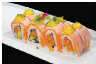
86. FRAMBE ROLL € 12,00 tartare di salmone, avocado, tabasco, salmone scottato alla fiamma, salsa zafferano e pistacchio