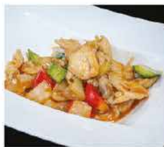
197. POLLO IN SALSA PICCANTE € 6,00