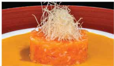
42. SAKE TARTAR € 8,00 tartare di salmone, kataifi, salsa di verdure e frutta