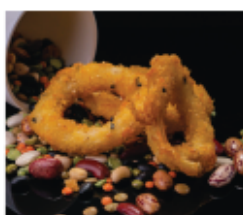
216. CALAMARI* FRITTI € 8,00