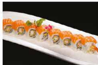
81. TIGER € 12,00 gamberi* fritti avvolto al salmone e teriyaki