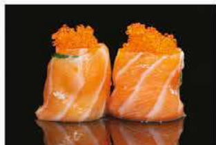
142. GUNKAN ZUCCHINE SPECIALE € 5,00 pallina di riso avvolto salmone, philadelphia, zucchine e tobiko