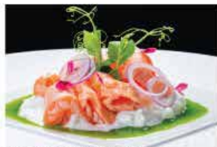
314. TATAKI SALMONE SPECIALE € 12,00 salmone scottato, burrata, salsa rucola, sale nero e mango