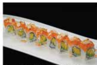
88. ROCK'N'ROLL € 12,00 avocado, philadelphia, tartare di salmone e scaglie di mandorle croccante