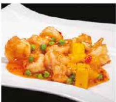
207. GAMBERI* CON MANGO € 8,00