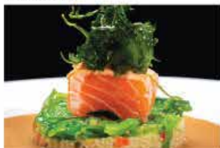
316. RISOTTO ITALIAN STYL € 12,00 risotto, gomme wakame*, oliva nera, pomodorini, salmone scottato fritto, rucola e salsa sesamo