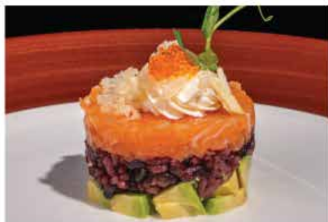
48. TARTAR NERO BURGER € 10,00 tartar di salmone con riso venere, avocado, scaglie di tempura, philadelphia, tobiko e salsa mango