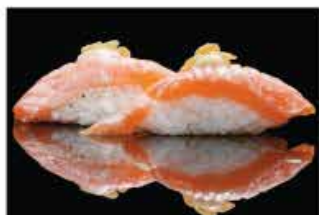
123. NIGHIRI SALMONE COTTO € 4,00 salmone alla fiamma con salsa latte e mandorle