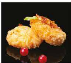
7. KOROKKE* 2PZ € 6,00 crochetta di patate giapponese, surimi di granchio e cipolla