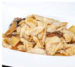
195. POLLO CON, FUNGHI E BAMBU € 6,00