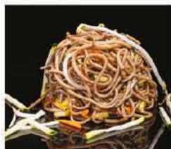
188. YAKI SOBA CON VERDURE € 6,00