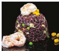
179. RISO VENERE CON GAMBERI € 8,00 riso venere saltato con uova, verdure e gamberi*