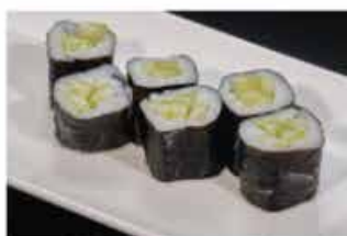
64. HOSOMAKI KAPPA € 4,00 cetrioli