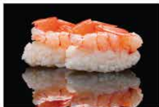
120. NIGHIRI AMAEBI € 5,00 gambero* crudo