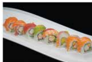
90. RAINBOW € 12,00 granchio*, avocado, maionese avvolto da pesce misto