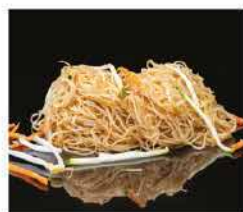
180. SPAGHETTI DI RISO CON VERDURE € 6,00