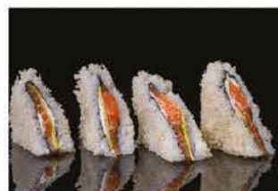
80. TRAMEZZINI DI SALMONE 4PZ € 8,00 tramezzini di sushi con salmone, philadelphia, avocado e scaglie di tempura