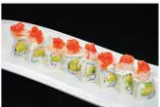
93. AMAEBI ROLL € 12,00 avocado, philadelphia, gamberi* crudi, pomodoro e salsa kanpai