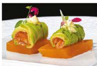
304. KANPAI FLESH SALMONE € 12,00

gamberi* rossi, capesante, wasabi fresco e sale nero