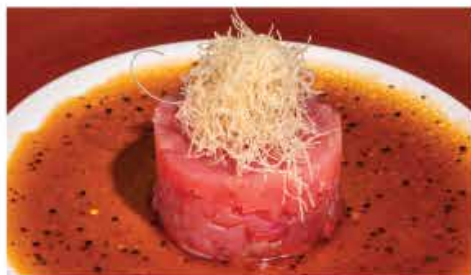
43. MAGURO TARTAR € 10,00 tartare di tonno, kataifi, salsa di soia e aceto