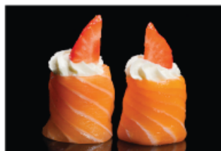
139. GUNKAN FRAGOLA € 5,00 pallina di riso avvolto con salmone, philadelphia e fragola