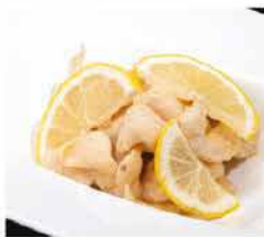
196. POLLO AL LIMONE € 6,00