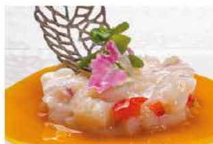
311. TARTAR CAPESANTE € 12,00

arancia, salmone, salsa avocado e salsa mango