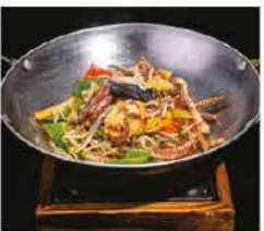
233. SCODELLA DI FUOCO CON CALAMARI* PICCANTE € 10,00 funghi, cipollotti, germogli di soia, peperoni piccant e cuffie di calamari