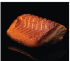
223. SALMONE ALLA GRIGLIA € 8,00