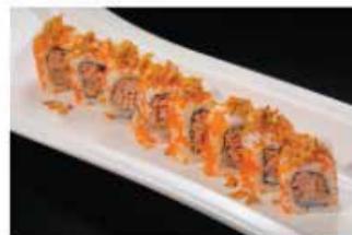
99. TONNO COTTO SPECIALE € 10,00 tonno cotto, maionese, salsa teriyaki, polpa di granchio* e cipolla secca