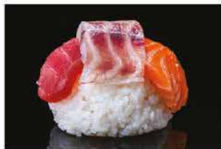
168. CHIRASHI MISTO € 12,00 salmon, tonno e branzino