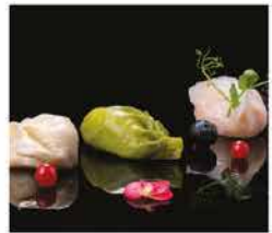
28. RAVIOLI DI MISTI* 3PZ € 4,50 carne, gamberi e verdure