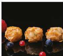
9. POLPETTE DI GAMBERI* € 6,00 gamberi, carne, cipolla, verdure, scaglie di mandorle fritte