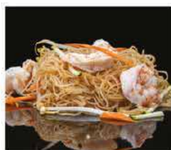
181. SPAGHETTI DI RISO CON GAMBERI* E VERDURE € 8,00