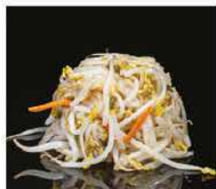
235. GERMOGLI DI SOIA € 6,00