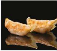
21. GYOZA* 3PZ € 3,00 carne e verdure alla griglia