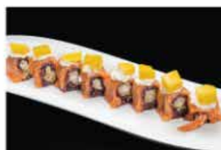
110. MANGO SPECIALE € 12,00 tempura di gamberi*, philadelphia avvolto da salmone e mango esterno