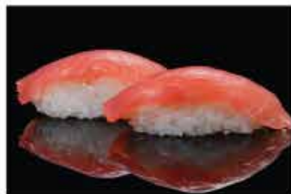
117. NIGHIRI TEKKA € 4,00 tonno