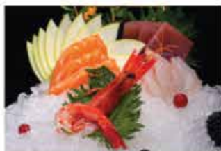
156. SASHIMI MISTO € 12,00 salmone, tonno, branzino e gambero* rosso 10 fette