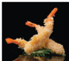
213. TEMPURA DI GAMBERI* € 10,00