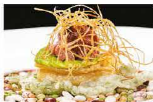
309. UOVA ALLA SALSICCIA PIEMONTESE € 12,00

avocado, philadelphia, zucchero canna, salmone, mango, salsa sesamo, ikura e cioccolato nero