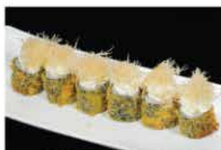
66. HOSOMAKI FRITTO € 8,00 salmone, philadelphia e kataifi