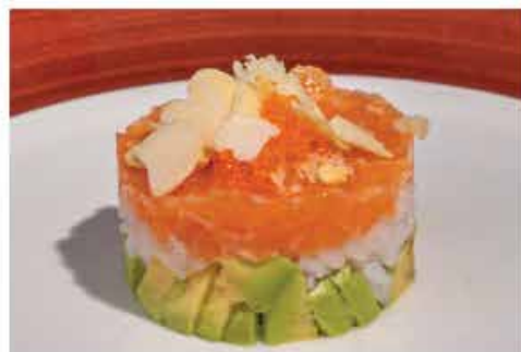
47. TARTAR BIANCO BURGER € 10,00 tartar di riso con salmone, avocado, crunch, philadelphia, mandorle, scaglie di tempura, tobiko e salsa teriyaki