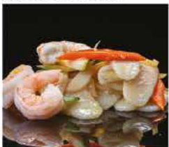
193. GNOCCHI DI RISO CON VERDURE E GAMBERI* € 8,00