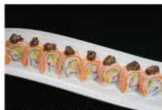
89. FRAMBE TARTUFO ROLL € 12,00 granchio*, maionese, avocado, avvolto con salmone alla fiamma, tobiko e salsa tartufo