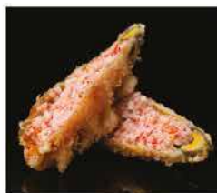
6. FIORE DI ZUCCA* € 5,00 surimi di granchio, tobiko, maionese, gamberi