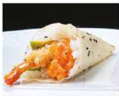
59. TEMAKI EBITEN SPECIALE € 5,00 tartare salmone, avocado e gamberi* in tempura