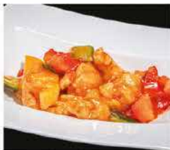
200. POLLO IN SALSA AGRODOLCE € 6,00