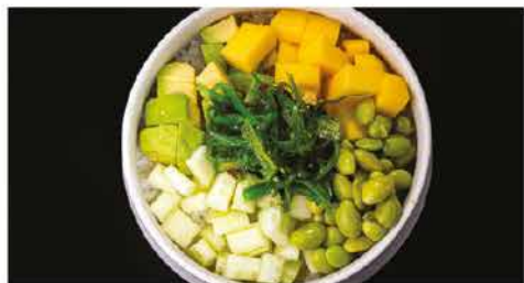
170. POKE VEGETAL € 10,00 ciotola di riso con cetriolo, avocado, fagioli, mango e alghe verde