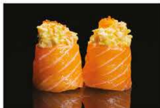
141. GUNKAN EBI € 6,00 pallina di riso avvolto con salmone, gamberi* cotto, tobiko e salsa