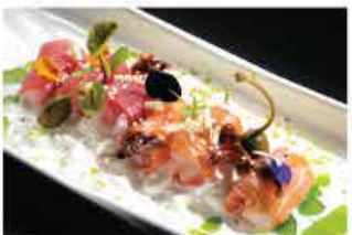
315. PESCE MISTO ALLA BURRATA € 12,00 burrata, salmone, gamberi* rossi, tonno, capesante, pomodoro secco, sale nero, cioccolato bianco e salsa rucola