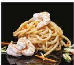
186. PASTE GIAPPONESI DI RISO CON GAMBERI* € 8,00