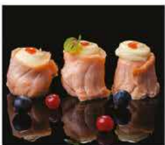
8. SAKE IMO YAKI 3PZ € 6,00 salmone arrotolato con pure di patate e salsa teriyaki