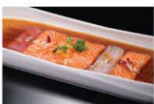
162. CARPACCIO MISTO € 12,00 salmone tonno branzino