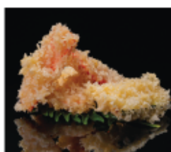
215. TEMPURA DI VERDURE € 8,00