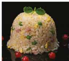
173. RISO ALLA CANTONESE € 6,00 riso bianco saltato con uova, verdure e prosciutto