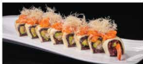
112. CHEESE SPICY ROLL € 12,00 gamberi* e avocado, formaggio, salmone piccante e kataifi