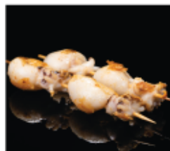
221. SPIEDINI DI SEPIE* 2PZ € 6,00