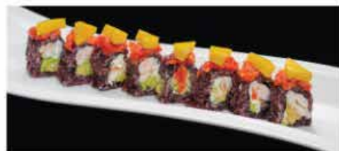
111. SPECIALE ESOTIC € 12,00 gamberi* cotto, avocado, crunch, mango, pomodoro, maionese, salsa frutta della passione e salsa teriyaki