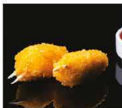
10. CHELE DI GRANCHIO FRITTO* 4PZ € 6,00 pasta di farina arrotolata con granchio