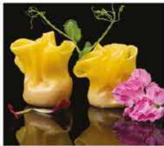
25. RAVIOLI DI POLIPO* 3PZ € 3,00 polipo e gamberi