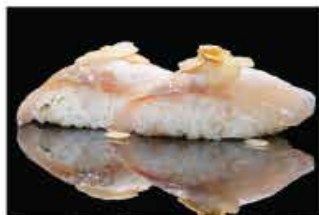
126. NIGHIRI SUZUKI COTTO € 4,00 branzino alla fiamma con salsa latte e mandorle