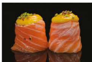
144. GUNKAN FRABEM € 6,00 pallina di riso avvolto da salmone, salsa zafferano alla fiamma e pistacchio