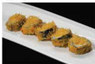
115. FUTOMAKI FRITTO € 12,00 salmone, avocado, philadelphia, tobiko e patate fritte