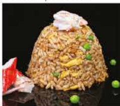
177. RISO CON PESCE ALLA GIAPPONESE € 8,00 riso bianco saltato con uova, verdure, pesce misto* e salsa giapponese di soia