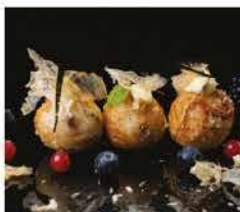
11. TAKOYAKI* € 6,00 polipo, patate, farina, maionese, scaglie di pesce essiccato