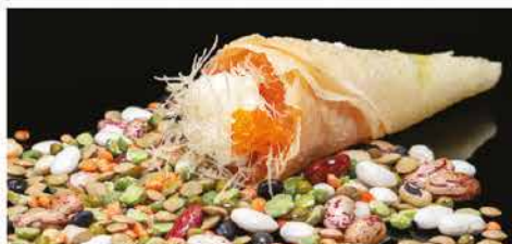
56. TEMAKI CRUNCHY € 6,00 cono con tritato di salmone piccante, philadelphia, pasta kataifi, tobiko e salsa teriyaki