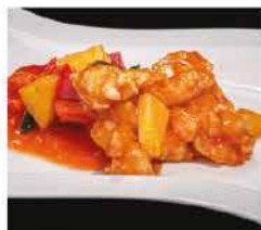
206. GAMBERI* IN SALSA AGRODOLCE € 8,00