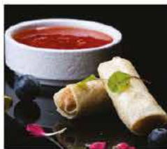
2. HARUMAKI* 2PZ € 3,00 involtino di gamberi e verdure