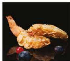
5. GAMBERI IMPANATI CON MANDORLE* € 6,00 gamberi impanati con le scaglie di mandorle