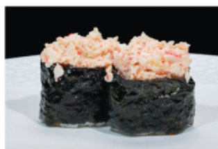
131. GUNKAN KANI € 4,00 pallina di riso con granchio e volante