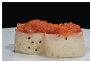
134. GUNKAN SOY TUNA € 5,00 pallina di riso avvolto con foglia di soia e sesamo con spicy tonno