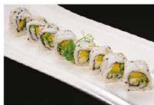
79. URAMAKI JUST VEGETAL € 8,00 verdure mix avocado