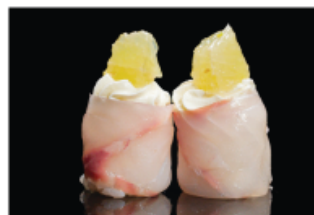
137. GUNKAN SUZUKI € 5,00 pallina di riso avvolto con branzino, philadelphia e lime