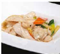
194. POLLO CON VERDURE MISTE € 6,00