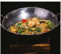
232. SCODELLA DI FUOCO AI GAMBERI* PICCANTE € 10,00 funghi, cipollotti, germogli di soia, peperoni piccante e gamberi