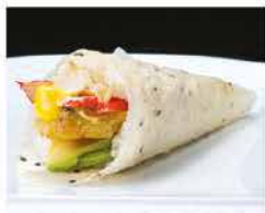
60. TEMAKI FIORI DI ZUCCA € 5,00 fiori di zucca, surimi di granchio*, avocado e salsa zafferano