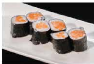
61. HOSOMAKI SAKE € 4,00 salmone