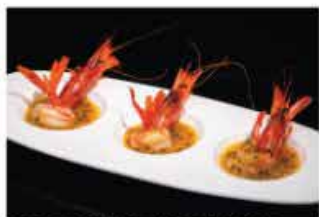
157. SASHIMI AMAEBI 4PZ € 10,00 gamberi* rossi con salsa frutta della passione