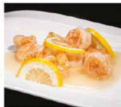
203. GAMBERI* AL LIMONE € 8,00