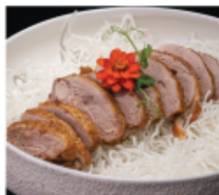
211. ANATRA ARROSTO € 10,00