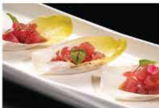
404. TONNO ALLE FOGLIE € 8,00 tonno cipollini salsa frutta