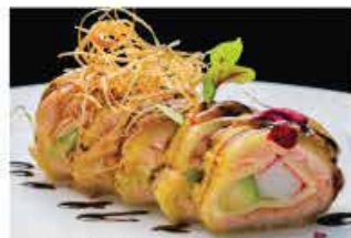
320. FOIE GRAS ROLL € 15,00 panè, formaggio, granchio*, avocado, riso bianco, salmone affumicato, foie gras, salsa basalmico e fritto di cipollotti francese