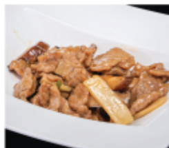
209. MANZO CON FUNGHI E BAMBÙ € 8,00