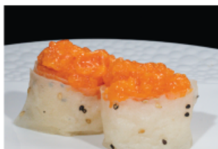
133. GUNKAN SOY SALMONE € 4,00 pallina di riso avvolto con foglia di soia e sesamo con spicy salmone