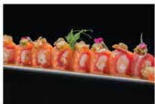
321. DRAGON FLESH € 12,00 salmone, tonno, avocado, riso bianco, tempura gamberi*, fiori di zucca, ikura, salsa lime e salsa sesamo