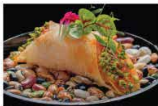
406. TACOS MINI € 6,00 salmone piccante pistacchio salsa lime