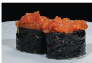
130. GUNKAN SPICY TUNA € 5,00 pallina di riso con tonno, tabasco, maionese e tobiko