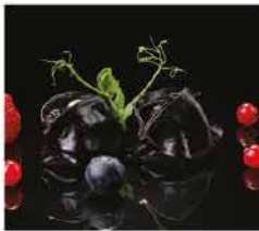
26. RAVIOLI DI SEPIE* 3PZ € 3,00 pesce e seppie