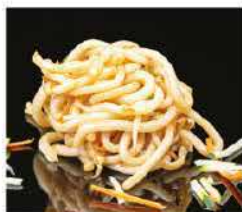
185. PASTE GIAPPONESI DI RISO CON VERDURE € 6,00