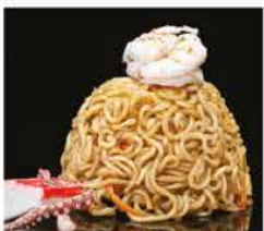
190. RAMEN CON FRUTTI DI MARE* SALTATO € 10,00