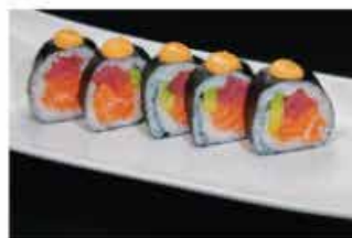
113. FUTOMAKI KANPAI € 10,00 tonno, salmone, avocado e salsa piccante