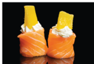
138. GUNKAN MANGO € 5,00 pallina di riso avvolto con salmone, philadelphia e mango