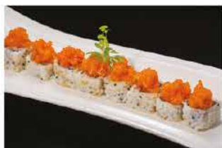
75. SPICY SALMON € 8,00 salmone, salsa piccante, maionese e tobiko