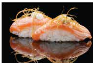
124. NIGHIRI SALMONE STILY € 4,00 salmone alla fiamma, philadelphia, pasta kataifi e salsa teriyaki