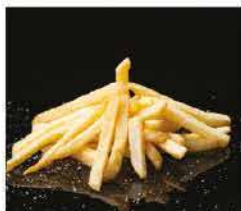
13. PATATINE FRITTE* € 3,00