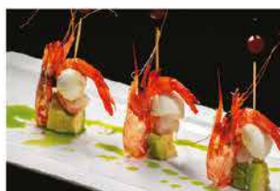
305. GREEN FINGER € 12,00

gelatina di frutta, salmone, avocado, salsa lime e salsa mango