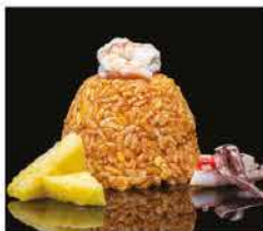
175. RISO CON FRUTTI DI MARE ALLA THAIANDESE € 8,00 riso bianco saltato con uova, pesce misto alla salsa thailandese e ananas