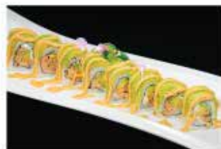
91. MIURA SPECIALE € 12,00 salmone cotto, philadelphia, avocado, salsa maionese piccante e salsa teriyaki