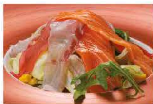
31. INSALATA CON PESCE MISTO € 6,00 insalata, mais, pomodorini, pesce mix crudo, alghe e salsa insalata (sesamo e philadelphia)