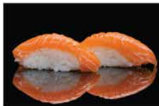
116. NIGHIRI SAKE € 3,00 salmone