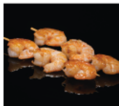
220. SPIEDINI DI GAMBERI 2 PZ € 6,00