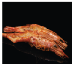
222. GAMBERONI* ALLA GRIGLIA 2PZ € 6,00