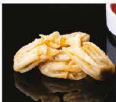
12. WANTON FRITTO* 4PZ € 4,00 ravioli di carne sottile