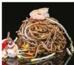
189. YAKI SOBA CON VERDURE E GAMBERI* € 8,00