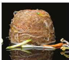
183. SPAGHETTI DI SOIA CON VERDURE € 6,00