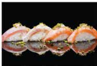
127. NIGHIRI SPECIAL 4PZ € 8,00 salmone alla fiamma con salsa di latte e pistacchio