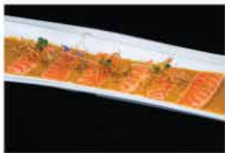
164. SAKE SCOTTATO € 10,00 salmone scottato e salsa kanpai