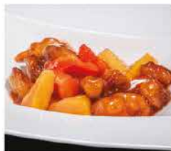
201. MAIALE IN SALSA AGRODOLCE € 6,00