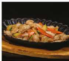
227. POLLO CON VERDURE ALLA PIASTRA € 8,00