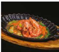
228. GAMBERONI* CON VERDURE ALLA PIASTRA € 10,00