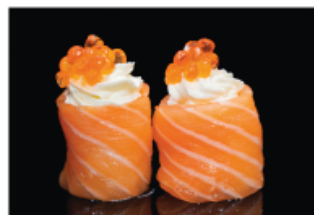
140. GUNKAN IKURA € 6,00 philadelphia, uova di salmone avvolto con salmone