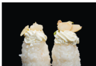
132. GUNKAN PHILADELPHIA € 4,00 pallina di riso con philadelphia e mandorle