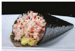
51. TEMAKI CALIFORNIA € 4,00 granchio, avocado e maionese