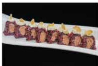
105. VENERE TONNO COTTO € 10,00 tonno cotto, philadelphia e scaglie di mandorle

ROTOLO CON RISO VENERE CREATIVO DELLO CHEF 8 PZ