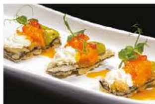
307. KANPAI TEMPURA DI ALGA € 12,00

gamberi* cotti, fritto di pane, salsa avocado, wasabi fresco, philadelphia, trattati di salmone, piccanti e ikura