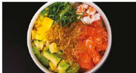
169. POKE KANPAI € 10,00 ciotola di riso con salmone, gamberi* cotti, avocado, alghe verde, mango, cipolla croccante, salsa mango e salsa teriyaki