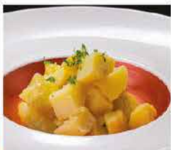
238. PATATE E PREZZEMOLO € 6,00 patate lesse con prezzemolo

* per motivi stagionali i prodotti contrassegnati possono essere surgelati