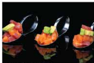
46. TARTARE MIX 3 CUCCHIAIO € 10,00 tartar di pesce mix e avocado con salsa ponzu