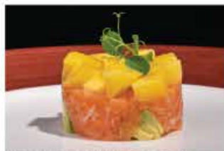
44. TARTAR MANGO FRESH € 10,00 tritato di salmone con avocado, mango e salsa mango