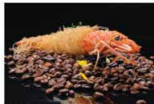
408. EBI KATAIFI* € 5,00 gamberoni avvolto con pasta kataifi fritto e miele