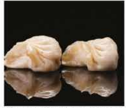
20. RAVIOLI DI CARNE* 3PZ € 3,00 carne e verdure