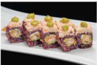
104. TIGER PLUS € 12,00 gamberi* in tempura, philadelphia, surimi di granchio* e salsa guacamola