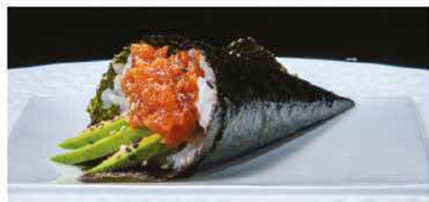
55. TEMAKI SPICY TUNA € 4,00 tonno, tabasco, maionese, tobiko e avocado