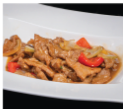
210. MANZO IN SALSA PICCANTE € 8,00