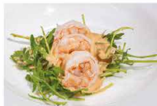
36. GAMBERI COCKTAIL € 6,00 gamberi*, salsa rosa e rucola