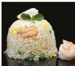
174. RISO CON GAMBERI E VERDURE € 8,00 riso bianco saltato con uova, verdure e gamberi*