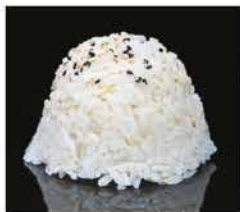
171. RISO BIANCO € 2,00