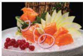
154. SASHIMI SAKE € 10,00 salmone 9 fette