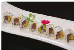
73. MAGURO €10,00 tonno e avocado