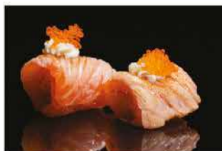
149. SALMONE ROLL € 6,00 tempura di gamberi* avvolto con salmone alla fiamma, philadelphia e tobiko