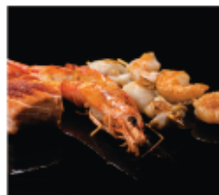
225. PESCE MISTO ALLA GRIGLIA € 10,00