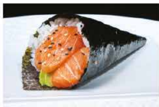
49. TEMAKI SAKE € 4,00 salmone e avocado