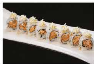
78. MIURA € 8,00 philadelphia e salmone cotto