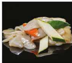
192. GNOCCHI DI RISO CON VERDURE € 6,00