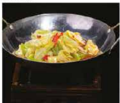
234. SCODELLA DI FUOCO ALLE VERZE PICCANTE € 8,00 cipollotti, peperoni piccante e verze