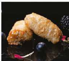
3. INVOLTINI VIETAMITI* 2PZ € 3,00 involtino di verdure e carne