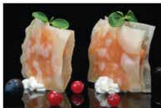
403. MILLE FOGLIE AL SALMONE € 6,00 fogli di soia con tartare di salmone piccante, philadelphia e tobiko