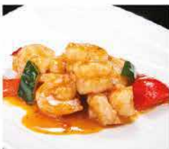
208. GAMBERI* IN SALSA PICCANTE € 8,00