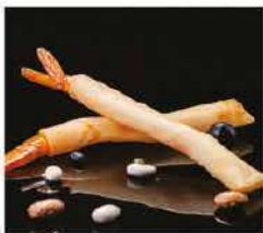
4. EBI STIK* 4PZ € 6,00 gamberi fritti avvolto con foglio di primavera