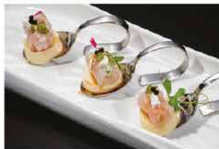
302. COCKTAIL DI RICCIOLA E GAMBERI ROSSI € 10,00

pesce misto, gamberi* rossi, scampi, salmone scottato, tonno scottato, branzino scottato, salsa yogurt, salsa rucola e ikura