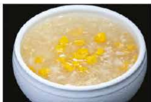
38. ZUPPA MAIS E POLLO € 4,00 pollo, mais e uova