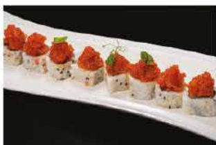
76. SPICY TUNA € 8,00 tonno, salsa piccante, maionese e tobiko