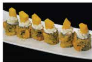
69. HOSOMAKI MANGO € 8,00 salmone, philadelphia e mango