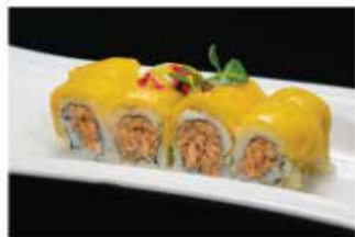
97. MANGO FRESH ROLL € 12,00 salmone cotto, philadelphia, mango, salsa teriyaki e salsa mango