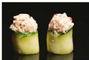
148. GUNKAN ZUCCHINE € 5,00 pallina di riso avvolto con zucchine, polpa di granchio* cotto e maionese