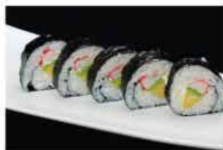
114. FUTOMAKI CALIFORNIA € 10,00 granchio*, avocado e philadelphia