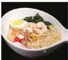
191. RAMEN CON FRUTTI DI MARE* IN BRODO € 10,00