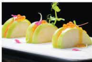
400. APPLE VERDE € 8,00 mela verde, salmone piccante, ikura e salsa mango