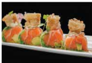
319. TRIS DI INVOLTINI VIETNAMITI € 7,00 avocado, wakame, salmone philadelphia, tempura gamberi* e salsa sesamo