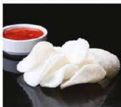
14. NUVOLETTE DI DRAGO € 3,00 patate di gamberi fritti