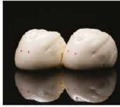
19. PANE DOLCE CINESE* € 4,00 pane ripieno di crema d'uova