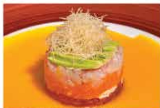
45. TARTAR MIX € 10,00 tartare di salmone, tonno, branzino, avocado e kataifi