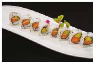
72. SAKE € 8,00 salmone e avocado