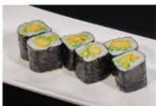
65. HOSOMAKI AVOCADO € 4,00 avocado