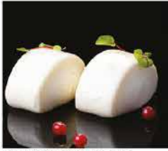
17. PANE VAPORE GIAPPONESE* 2PZ € 3,00 pane bianco