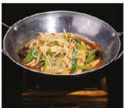
231. SCODELLA DI FUOCO DI POLLO PICCANTE € 10,00 funghi, cipollotti, germogli di soia, peperoni piccante e pollo