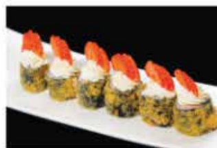
67. HOSOMAKI FRAGOLA € 8,00 salmone, philadelphia e fragola