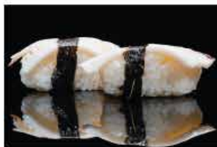
121. NIGHIRI TAKO € 5,00 polipo*