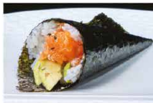
54. TEMAKI SPICY SAKE € 4,00 salmone, tabasco, maionese, tobiko e avocado