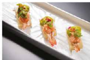
306. TOAST AI GAMBERI COTTI € 8,00

avocado, gamberi* rossi, mozzarella, salsa latte e salsa rucola