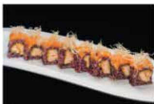
107. MIURA PLUS € 12,00 salmone fritto, philadelphia, tartare di salmone, pasta kataifi e salsa rucola