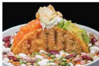
405. SAKE TACOS € 6,00 tritato salmone con philadelphia, avocado, scaglie di mandorle, insalata e salsa teriyaki