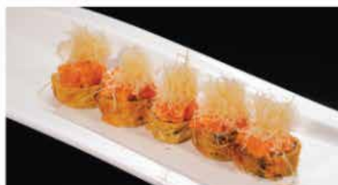
71. NIDO ROLL € 10,00 rotolo di riso con salmone avvolto dall' alghe pasta kataifi accompagnata con tartar salmone piccante con salsa teriyaki