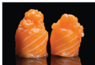
135. GUNKAN GIO SALMON € 5,00 pallina di riso avvolto con salmone e spicy salmone