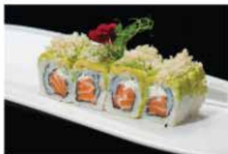
98. FEVER ROLL € 12,00 philadelphia, salmone, scaglie di tempura, avocado, crunch, salsa teriyaki