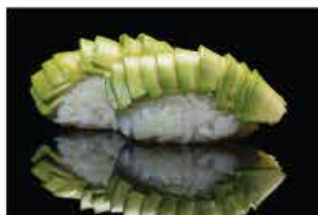
122. NIGHIRI AVOCADO € 4,00 avocado