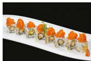
87. EXOTIC € 12,00 gamberi* fritti guarnito con tartar di salmone piccante