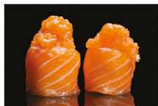
135. GUNKAN GIO SALMON € 5,00 pallina di riso avvolto con salmone e spicy salmone