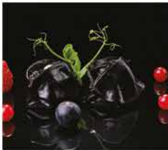
26. RAVIOLI DI SEPIE* 3PZ € 3,00 pesce e seppie