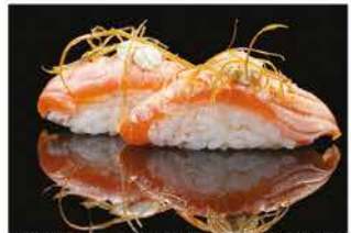
124. NIGHIRI SALMONE STILY € 4,00 salmone alla fiamma, philadelphia, pasta kataifi e salsa teriyaki