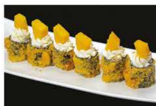
69. HOSOMAKI MANGO € 8,00 salmone, philadelphia e mango