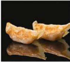
21. GYOZA* 3PZ € 3,00 carne e verdure alla griglia