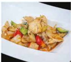
197. POLLO IN SALSA PICCANTE € 6,00