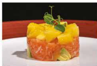
44. TARTAR MANGO FRESH € 10,00 tritato di salmone con avocado, mango e salsa mango