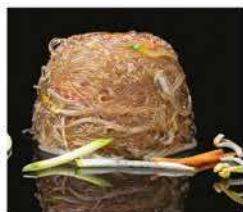
183. SPAGHETTI DI SOIA CON VERDURE € 6,00