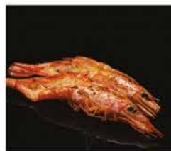
222. GAMBERONI* ALLA GRIGLIA 2PZ € 6,00