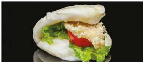
29. BAO CON POLLO € 4,00 pane ripieno con insalata, pomodoro, pollo fritto e salsa rosa