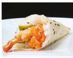
59. TEMAKI EBITEN SPECIALE € 5,00 tartare salmone, avocado e gamberi* in tempura