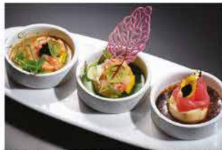
313. TARTAR MISTO SPECIALE € 12,00

gamberi* crudi, pomodori, olio di oliva, bufala, salsa rucola e fritto di cipollotti