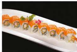
81. TIGER € 12,00 gamberi* fritti avvolto con salmone e teriyaki