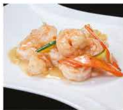
202. GAMBERI* CON VERDURE MISTE € 8,00