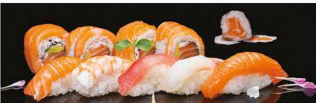
128. SUSHI MISTO 12PZ € 12,00 5 nighiri, 3 hossomaki e 4 uramaki