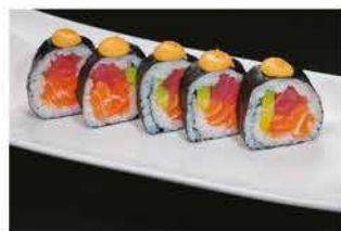
113. FUTOMAKI KANPAI € 10,00 tonno, salmone, avocado e salsa piccante