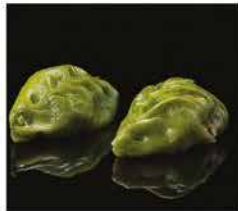
27. RAVIOLI DI VERDURE* 3PZ € 3,00 verdure