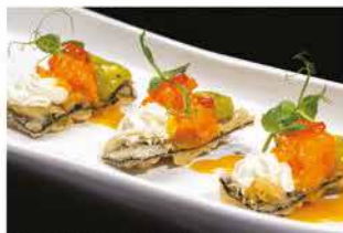
307. KANPAI TEMPURA DI ALGA € 12,00

gamberi* cotti, fritto di pane, salsa avocado, wasabi fresco, philadelphia, tritati di salmone, piccanti e ikura