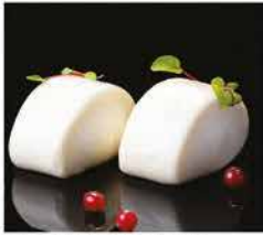
17. PANE VAPORE GIAPPONESE* 2PZ € 3,00 pane bianco