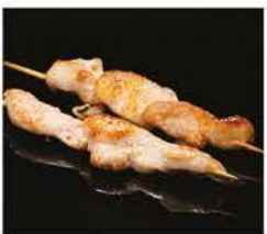
219. SPIEDINI DI POLLO 2PZ € 6,00