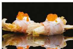
411. INVOLTINI FIOR BRANZINO € 5,00 tempura di fiore di zucca avvolto con carpaccio di branzino