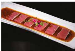
165. TUNA SCOTTATO € 10,00 tonno scottato con salsa wasabi