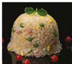
173. RISO ALLA CANTONESE € 6,00 riso bianco saltato con uova, verdure e prosciutto