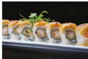
323. BANANA ROLL € 10,00

tonno cotto, mais, rucola, philadelphia, pomodoro secco e gambero* crudo