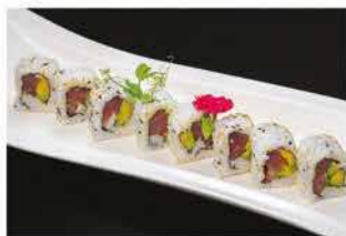
73. MAGURO €10,00 tonno e avocado