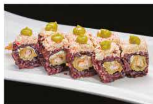
104. TIGER PLUS € 12,00 gamberi* in tempura, philadelphia, surimi di granchio* e salsa guacamole