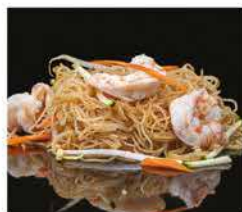
181. SPAGHETTI DI RISO CON GAMBERI* E VERDURE € 8,00