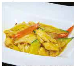
199. POLLO AL CURRY € 6,00