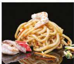
187. PASTE GIAPPONESI DI RISO CON MARE* € 10,00