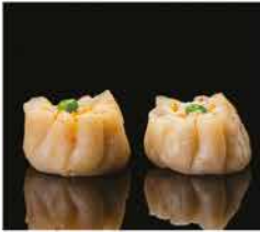
22. RAVIOLI DI GAMBERI* 3PZ € 3,00 gamberi, carne e verdure