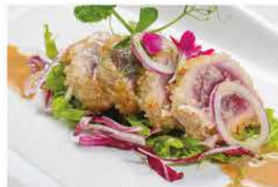
317. KANPAI MAGURO STILY € 12,00

risotto, goma wakame*, oliva nera, pomodorini, salmone scottato fritto, rucola e salsa sesamo