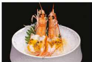
158. SCAMPI PASSION FRUIT 4PZ € 12,00 scampi* con salsa frutta della passione