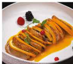
212. ANATRA ALL'ARANCIA € 10,00