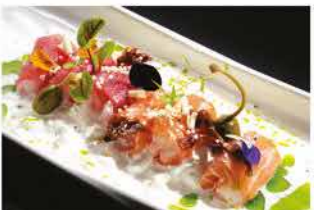
315. PESCE MISTO ALLA BURRATA € 12,00

salmone scottato, burrata, salsa rucola, sale nero e mango