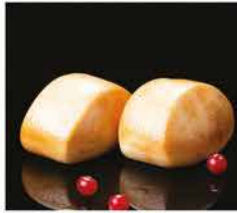
18. PANE FRITTO GIAPPONESE* 2PZ € 3,00 pane bianco fritto