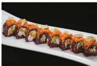
106. EBI MANDORLE € 12,00 fiore di zucca, gamberi* cotti, salmone esterno mandorle e salsa rucola