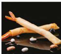
4. EBI STIK* 4PZ € 6,00 gamberi fritti avvolto con foglio di primavera