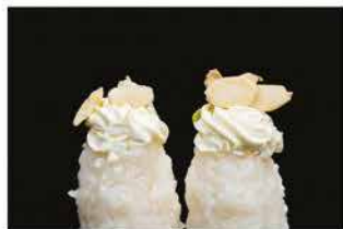
132. GUNKAN PHILADELPHIA € 4,00 pallina di riso con philadelphia e mandorle