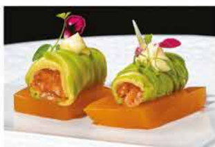
304. KANPAI FLESH SALMONE € 12,00

gamberi* rossi, capesante, wasabi fresco e sale nero