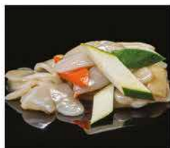
192. GNOCCHI DI RISO CON VERDURE € 6,00