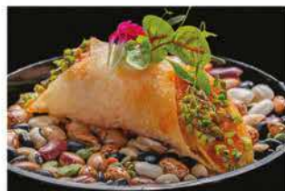
406. TACOS MINI € 6,00 salmone piccante, pistacchio e salsa lime