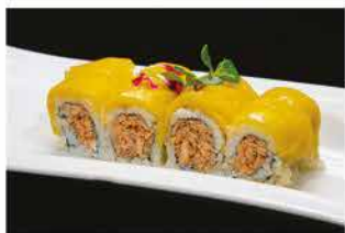
97. MANGO FRESH ROLL € 12,00 salmone cotto, philadelphia, mango, salsa teriyaki e salsa mango