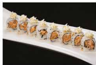
78. MIURA € 8,00 philadelphia e salmone cotto