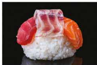
168. CHIRASHI MISTO € 12,00 salmone, tonno e branzino