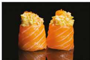
141. GUNKAN EBI € 6,00 pallina di riso avvolto con salmone, gamberi* cotto, tobiko e salsa