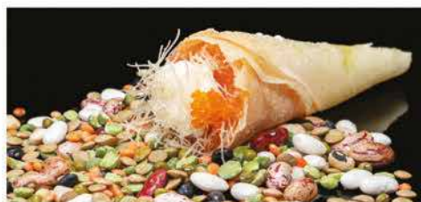
56. TEMAKI CRUNCHY € 6,00 cono con tritato di salmone piccante, philadelphia, pasta kataifi, tobiko e salsa teriyaki