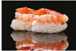
120. NIGHIRI AMAEBI € 5,00 gambero* crudo