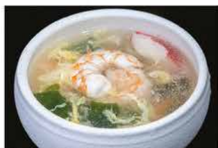
40. ZUPPA DI MARE € 4,00 zuppa di pesce misto, uova e alghe