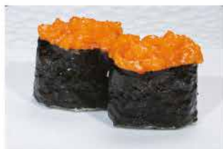
129. GUNKAN SPICY SALMON € 4,00 pallina di riso con salmone, tabasco, maionese e tobiko