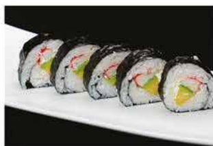
114. FUTOMAKI CALIFORNIA € 10,00 granchio*, avocado e philadelphia