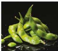
15. EDAMAME* € 4,00 fagioli di soia lessi e sale