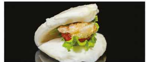
30. BAO CON GAMBERI € 4,00 pane ripieno con insalata, pomodoro, gamberi* fritti e salsa rosa