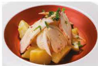
34. INSALATA DI POLIPO E PATATE € 8,00 patate* lessi con polipo e prezzemolo