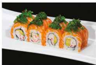
84. BENNY € 12,00 granchio*, philadelphia, avocado, avvolto con salmone e alghe piccante