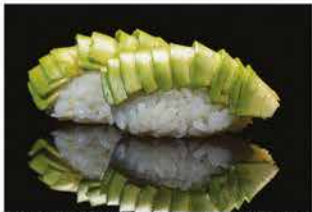
122. NIGHIRI AVOCADO € 4,00 avocado