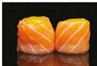
143. GUNKAN QUAGLIA € 6,00 pallina di riso avvolto salmone e uova di quaglia