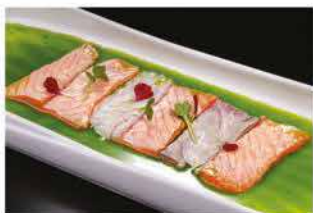
163. CARPACCIO MISTO SCOTTATO € 12,00 pesce misto scottato in salsa rucola