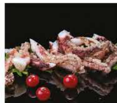
218. CIUFFETTI DI POLIPO* PICCANTI € 8,00