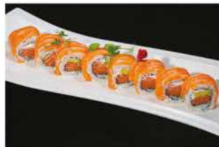
82. SALMON OUT € 12,00 avocado, philadelphia avvolto da salmone esterno