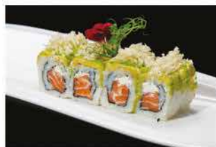
98. FEVER ROLL € 12,00 philadelphia, salmone, scaglie di tempura, avocado, crunch, salsa teriyaki