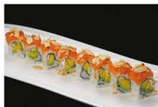
88. ROCK'N'ROLL € 12,00 avocado, philadelphia, tartare di salmone e scaglie di mandorle croccante