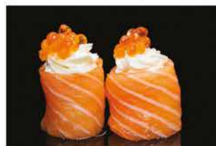
140. GUNKAN IKURA € 6,00 pallina di riso avvolto con salmone, philadelphia e uova di salmone