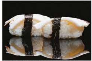
121. NIGHIRI TAKO € 5,00 polipo*