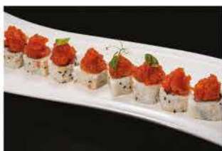
76. SPICY TUNA € 8,00 tonno, salsa piccante, maionese e tobiko