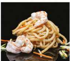
186. PASTE GIAPPONESI DI RISO CON GAMBERI* € 8,00