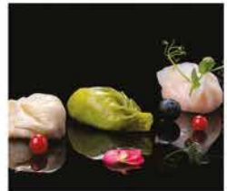
28. RAVIOLI MISTI* 3PZ € 4,50 carne, gamberi e verdure