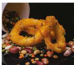
216. CALAMARI* FRITTI € 8,00