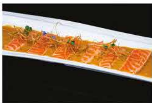
164. SAKE SCOTTATO € 10,00 salmone scottato e salsa kanpai