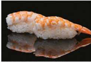
119. NIGHIRI EBI € 4,00 gambero* cotto