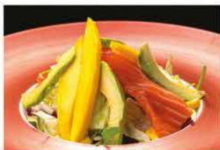
32. INSALATA MISTO SPECIALE € 6,00 insalata, mango, pesce misto, pomodorini e salsa insalata (sesamo e philadelphia)