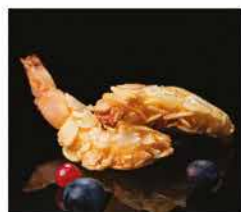
5. GAMBERI IMPANATI CON MANDORLE* € 6,00 gamberi impanati con le scaglie di mandorle