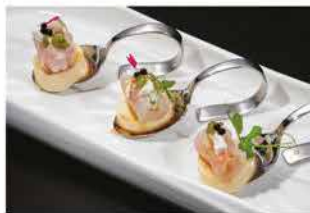
302. COCKTAIL DI RICCIOLA E GAMBERI ROSSI € 10,00

pesce misto, gamberi* rossi, scampi, salmone scottato, tonno scottato, branzino scottato, salsa yogurt, salsa rucola e ikura