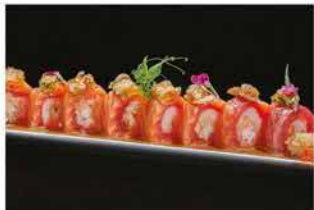
321. DRAGON FLESH € 12,00

pane, formaggio, granchio*, avocado, riso bianco, salmone affumicato, foie gras, salsa balsamico e fritto di cipollotti francese