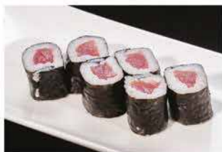
62. HOSOMAKI TEKKA € 5,00 tonno