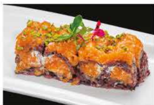
103. SALMONE PISTACCHIO € 12,00 tartare di salmone, philadelphia, pistacchio e salsa rucola