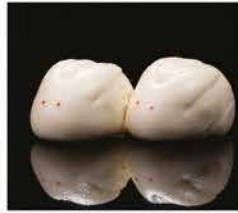
19. PANE DOLCE CINESE* € 4,00 pane ripieno di crema d'uova