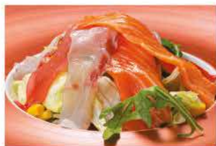
31. INSALATA CON PESCE MISTO € 6,00 insalata, mais, pomodorini, pesce mix crudo, alghe e salsa insalata (sesamo e philadelphia)