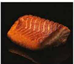
223. SALMONE ALLA GRIGLIA € 8,00