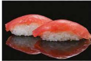
117. NIGHIRI TEKKA € 4,00 tonno