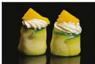
147. GUNKAN ZUCCHINA MANGO € 5,00 pallina di riso avvolto con zucchine, philadelphia e mango