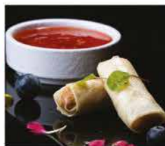
2. HARUMAKI* 2PZ € 3,00 involtino di gamberi e verdure