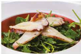
35. INSALATA POLIPO* E RUCOLA € 8,00