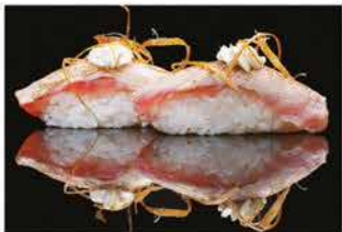
125. NIGHIRI TONNO € 5,00 tonno alla fiamma, philadelphia, pasta kataifi e salsa teriyaki