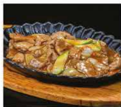
226. MANZO CON VERDURE ALLA PIASTRA € 8,00