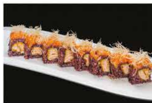
107. MIURA PLUS € 12,00 salmone fritto, philadelphia, tartare di salmone, pasta kataifi e salsa rucola