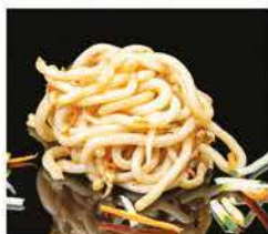
185. PASTE GIAPPONESI DI RISO CON VERDURE € 6,00