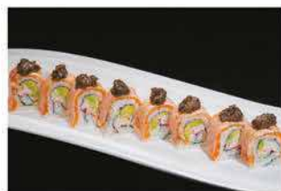
89. FRAMBE TARTUFO ROLL € 12,00 granchio*, maionese, avocado, avvolto con salmone alla fiamma, tobiko e salsa tartufo