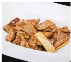
209. MANZO CON FUNGHI E BAMBÙ € 8,00