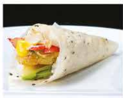
60. TEMAKI FIORI DI ZUCCA € 5,00 fiori di zucca, surimi di granchio*, avocado e salsa zafferano