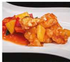
206. GAMBERI* IN SALSA AGRODOLCE € 8,00