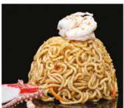
190. RAMEN CON FRUTTI DI MARE* SALTATO € 10,00