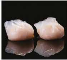
23. RAVIOLI DI GAMBERI TRASPARENTI* 3PZ € 3,00 gamberi e cipolle