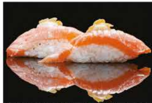
123. NIGHIRI SALMONE COTTO € 4,00 salmone alla fiamma con salsa latte e mandorle