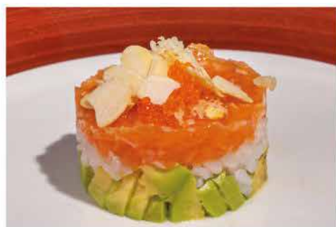
47. TARTAR BIANCO BURGER € 10,00 tartar di riso con salmone, avocado, crunch, philadelphia, mandorle, scaglie di tempura, tobiko e salsa teriyaki