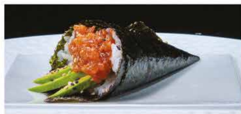
55. TEMAKI SPICY TUNA € 4,00 tonno, tabasco, maionese, tobiko e avocado