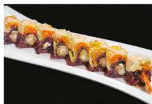
109. EBI FLO € 12,00 gamberoni* in tempura, philadelphia, tartare di salmone, fiore di zucca e salsa teriyaki