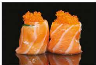
142. GUNKAN ZUCCHINE SPECIALE € 5,00 pallina di riso avvolto salmone, philadelphia, zucchine e tobiko