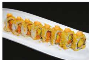
100. MEXICAN ROLL € 12,00 tartare di salmone, avocado, tortilla, maionese piccante