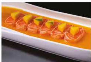
160. CARPACCIO PASSION FRUIT € 12,00 carpaccio di salmone con mango e salsa mango