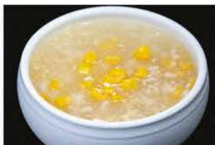
38. ZUPPA MAIS E POLLO € 4,00 pollo, mais e uova