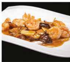
204. GAMBERI* CON FUNGHI E BAMBÙ € 8,00