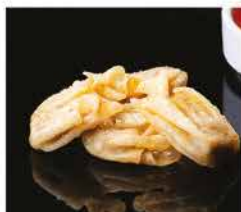
12. WANTON FRITTO* 4PZ € 4,00 ravioli di carne sottile