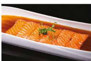
161. CARPACCIO SAKE € 10,00 salmone