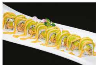
91. MIURA SPECIALE € 12,00 salmone cotto, philadelphia, avocado, salsa maionese piccante e salsa teriyaki