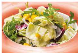
33. INSALATA MISTA € 5,00 insalata mista e mais