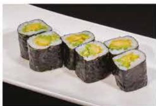
65. HOSOMAKI AVOCADO € 4,00 avocado