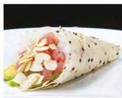
58. TEMAKI SPICY TUNA PLUS € 5,00 mandorle, avocado e spicy tuna