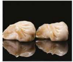
20. RAVIOLI DI CARNE* 3PZ € 3,00 carne e verdure