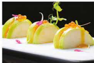
400. APPLE VERDE € 8,00 mela verde, salmone piccante, ikura e salsa mango