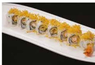
77. EBITEN € 8,00 gamberi* fritti e patate fritte