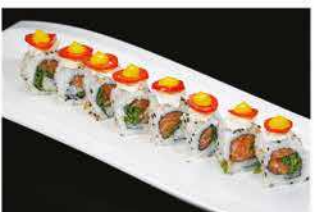
94. MALIBU ROLL € 12,00 salmone, rucola, philadelphia, insalata, pomodoro e salsa zafferano