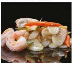
193. GNOCCHI DI RISO CON VERDURE E GAMBERI* € 8,00