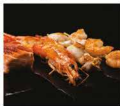
225. PESCE MISTO ALLA GRIGLIA € 10,00