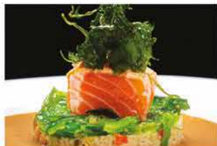
316. RISOTTO ITALIAN STILY € 12,00

burrata, salmone, gamberi* rossi, tonno, capesante, pomodoro secco, sale nero, cioccolato bianco e salsa rucola