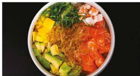
169. POKE KANPAI € 10,00 ciotola di riso con salmone, gamberi* cotti, avocado, alghe verde, mango, cipolla croccante, salsa mango e salsa teriyaki