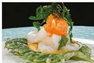
300. BISCOTTI AL CAPESANTE € 12,00

philadelphia, capesante, tritati di salmone piccante, tempura shiso tempura di rucola e salsa lime