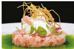
312. TARTAR GAMBERI ALLA BUFALA € 12,00

gamberi* crudi, pomodori, olio di oliva, bufala, salsa rucola e fritto di cipollotti