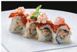
322. FUSION ROLL € 12,00

salmone, tonno, avocado, riso bianco, tempura gamberi*, fiori di zucca, ikura, salsa lime e salsa sesamo