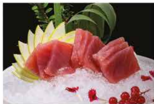
155. SASHIMI MAGURO € 12,00 tonno 9 fette