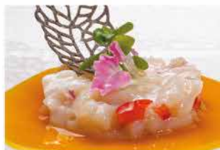
311. TARTAR CAPESANTE € 12,00

arancia, salmone, salsa avocado e salsa mango