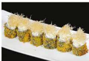
66. HOSOMAKI FRITTO € 8,00 salmone, philadelphia e kataifi