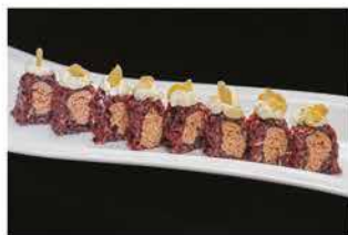
105. VENERE TONNO COTTO € 10,00 tonno cotto, philadelphia e scaglie di mandorle

ROTOLO CON RISO VENERE CREATIVO DELLO CHEF 8 PZ