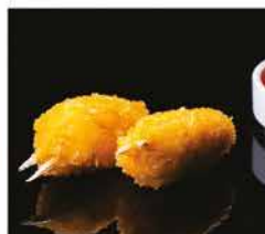
10. CHELE DI GRANCHIO FRITTO* 4PZ € 6,00 pasta di farina arrotolata con granchio