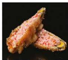
6. FIORE DI ZUCCA* € 5,00 surimi di granchio, tobiko, maionese e gamberi