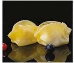
24. RAVIOLI DI MERLUZZO* 3PZ € 3,00 pesce bianco e gamberi