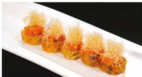
71. NIDO ROLL € 10,00 rotolo di riso con salmone avvolto dall' alghe pasta kataifi accompagnata con tartar salmone piccante con salsa teriyaki