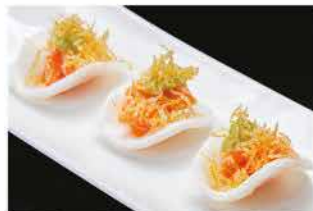
402. CHIPS DI DRAGON € 6,00 salmone piccante, avocado, patate fritte e salsa teriyaki