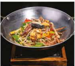
233. SCODELLA DI FUOCO CON CALAMARI* PICCANTE € 10,00 funghi, cipollotti, germogli di soia, peperoni piccanti e ciuffi di calamari