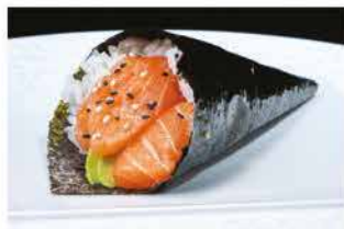
49. TEMAKI SAKE € 4,00 salmone e avocado