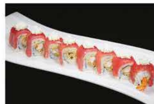
101. DRAGON SPECIALE € 12,00 tempura di gamberi*, avvolto con tonno e philadelphia