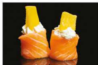
138. GUNKAN MANGO € 5,00 pallina di riso avvolto con salmone, philadelphia e mango