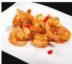
205. GAMBERI* CON SALE PEPE € 8,00