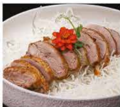
211. ANATRA ARROSTO € 10,00