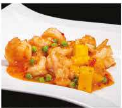
207. GAMBERI* CON MANGO € 8,00