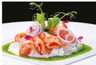
314. TATAKI SALMONE SPECIALE € 12,00

salmone, salsa avocado, uova di perut nera o bianca, salsa sesamo, gamberi* rossi, salsa rucola, burrata, foglie d'oro, tonno, tofufu, salsa xo, tartufo, bottarga di muggine e salsa wasabi