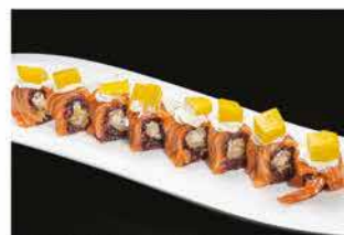
110. MANGO SPECIALE € 12,00 tempura di gamberi*, philadelphia avvolto da salmone e mango esterno