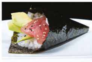
50. TEMAKI MAGURO € 4,00 tonno e avocado