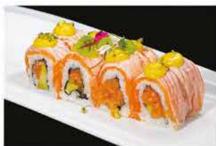
86. FRAMBE ROLL € 12,00 tartare di salmone, avocado, tabasco, salmone scottato alla fiamma, salsa zafferano e pistacchio