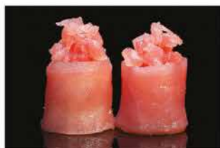
136. GUNKAN GIO TUNA € 6,00 pallina di riso avvolto con tonno e spicy tonno