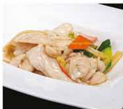
194. POLLO CON VERDURE MISTE € 6,00