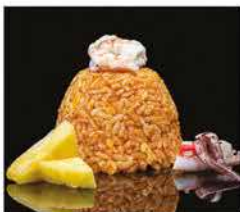
175. RISO CON FRUTTI DI MARE ALLA THAIANDESE € 8,00 riso bianco saltato con uova, pesce misto alla salsa thailandese e ananas