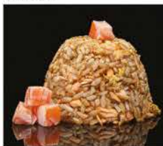
176. RISO SALTATO CON SALMONE € 8,00 riso bianco saltato con uova, salmone e salsa soia