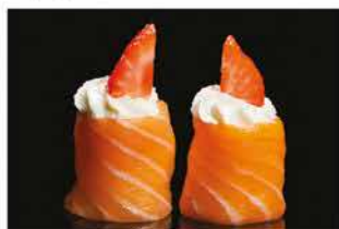
139. GUNKAN FRAGOLA € 5,00 pallina di riso avvolto con salmone, philadelphia e fragola