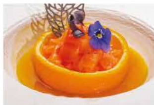
310. TARTAR SALMONE ALL'ARANCIA € 10,00

uova, tabasco, avocado, tempura shiso foglie fritto di cipollotti, polvere di olive nero e ikura