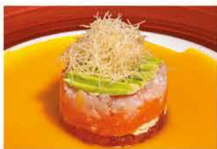
45. TARTAR MIX € 10,00 tartare di salmone, tonno, branzino, avocado e kataifi