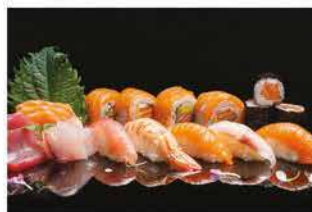
159. SUSHI E SASHIMI PICCOLO € 20,00 9 sashimi, 5 nigiri, 3 hosomaki e 4 uramaki