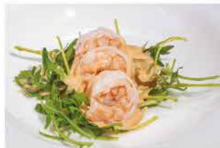
36. GAMBERI COCKTAIL € 6,00 gamberi*, salsa rosa e rucola