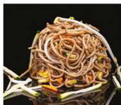
188. YAKI SOBA CON VERDURE € 6,00