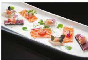
301. CARPACCIO DI YOGURT € 12,00

philadelphia, capesante, tritati di salmone piccante, tempura shiso tempura di rucola e salsa lime