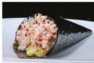
51. TEMAKI CALIFORNIA € 4,00 granchio, avocado e maionese