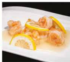
203. GAMBERI* AL LIMONE € 8,00