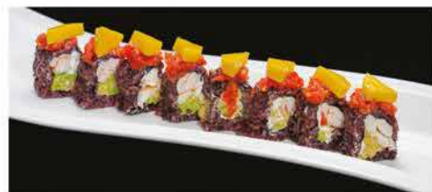
111. SPECIALE ESOTIC € 12,00 gamberi* cotto, avocado, crunch, mango, pomodoro, maionese, salsa frutta della passione e salsa teriyaki