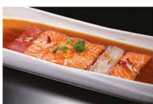
162. CARPACCIO MISTO € 12,00 salmone tonno branzino