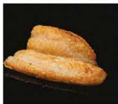
224. PESCE BIANCO ALLA GRIGLIA € 6,00