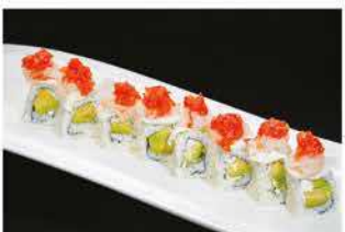
93. AMAEBI ROLL € 12,00 avocado, philadelphia, gamberi* crudi, pomodoro e salsa kanpai