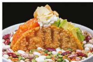
405. SAKE TACOS € 6,00 tritato salmone con philadelphia, avocado, scaglie di mandorle, insalata e salsa teriyaki