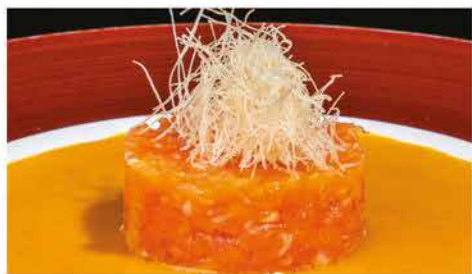
42. SAKE TARTAR € 8,00 tartare di salmone, kataifi, salsa di verdure e frutta