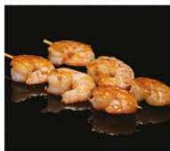
220. SPIEDINI DI GAMBERI 2 PZ € 6,00