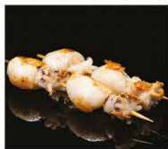
221. SPIEDINI DI SEPIE* 2PZ € 6,00