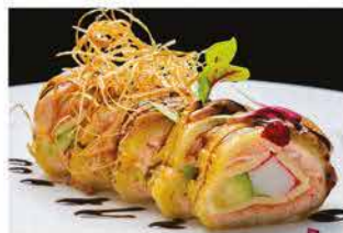
320. FOIE GRAS ROLL € 15,00

avocado, wakame, salmone, philadelphia, tempura gamberi* e salsa sesamo