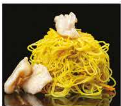
182. SPAGHETTI DI RISO CON POLLO AL CURRY € 8,00