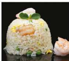
174. RISO CON GAMBERI E VERDURE € 8,00 riso bianco saltato con uova, verdure e gamberi*