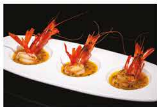
157. SASHIMI AMAEBI 4PZ € 10,00 gamberi* rossi con salsa frutta della passione