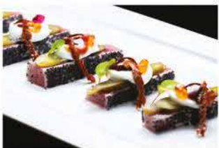
318. MAGURO TATAKI SPECIALI € 12,00

tonno impanato fritto, insalata mista e salsa sesamo