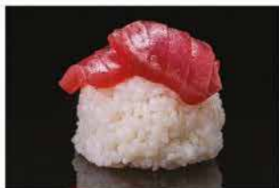
167. CHIRASHI MAGURO € 12,00 tonno