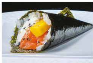
53. TEMAKI MANGO € 4,00 salmone, mango e philadelphia