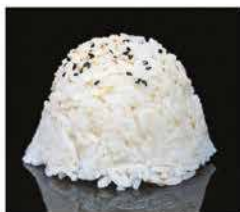
171. RISO BIANCO € 2,00