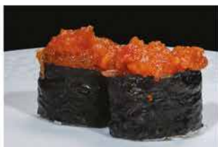
130. GUNKAN SPICY TUNA € 5,00 pallina di riso con tonno, tabasco, maionese e tobiko