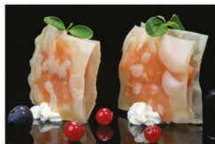
403. MILLE FOGLIE AL SALMONE € 6,00 foglie di soia con tartare di salmone piccante, philadelphia e tobiko