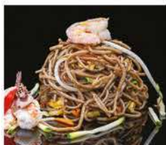
189. YAKI SOBA CON VERDURE E GAMBERI* € 8,00