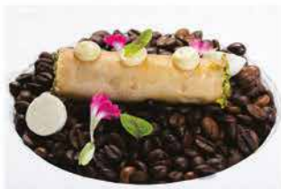
407. INVOLTINO DI TONNO COTTO € 6,00 tonno cotto, pistacchio, salsa lime e mozzarella