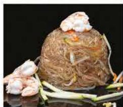
184. SPAGHETTI DI SOIA CON GAMBERI* E VERDURE € 8,00