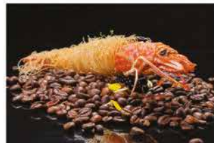
408. EBI KATAIFI* € 5,00 gamberoni avvolto con pasta kataifi fritto e miele