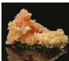
215. TEMPURA DI VERDURE € 8,00