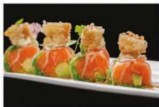
319. TRIS DI INVOLTINI VIETNAMITI € 7,00

tonno scottato, pomodoro secco, cetrioli all' aceto, burrata, ikura, salsa bbq e salsa wasabi