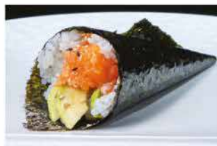
54. TEMAKI SPICY SAKE € 4,00 salmone, tabasco, maionese, tobiko e avocado