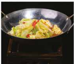
234. SCODELLA DI FUOCO ALLE VERZE PICCANTE € 8,00 cipollotti, peperoni piccante e verze