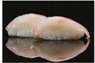
118. NIGHIRI SUZUKI € 3,00 branzino