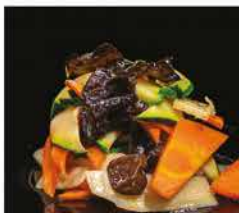
237. VERDURE MISTE SALTATE € 6,00