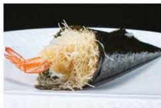
52. TEMAKI EBITEN € 4,00 gambero* fritto e avocado