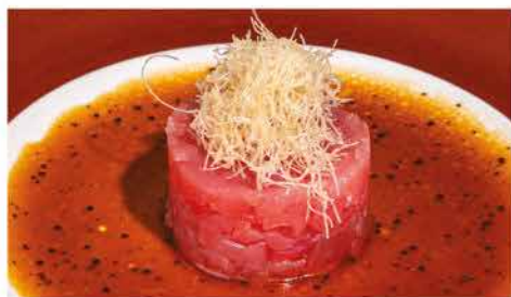
43. MAGURO TARTAR € 10,00 tartare di tonno, kataifi, salsa di soia e aceto