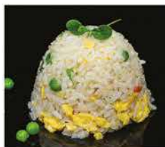
172. RISO CON VERDURE € 6,00 riso bianco saltato con uova e verdure