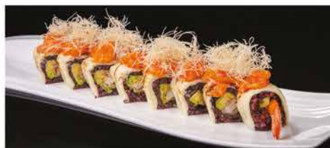
112. CHEESE SPICY ROLL € 12,00 gamberi* e avocado, formaggio, salmone piccante e kataifi