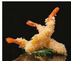
213. TEMPURA DI GAMBERI* € 10,00