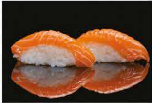
116. NIGHIRI SAKE € 3,00 salmone