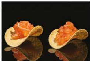
401. CHIPS SAKE € 4,00 tritato di salmone piccante, maionese, tobiko, salsa teriyaki, philadelphia e chips