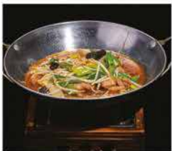
230. SCODELLA DI FUOCO DI MANZO PICCANTE € 10,00 funghi, cipollotti, germogli di soia, peperoni piccante e manzo