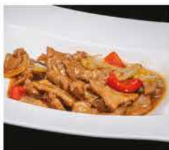
210. MANZO IN SALSA PICCANTE € 8,00