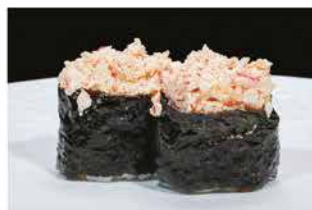
131. GUNKAN KANI € 4,00 pallina di riso con granchio e volante