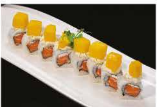
95. PHILADELPHIA E MANGO € 12,00 salmone, philadelphia e mango