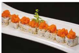
75. SPICY SALMON € 8,00 salmone, salsa piccante, maionese e tobiko