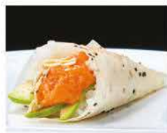
57. TEMAKI SPICY SALMONE PLUS € 5,00 mandorle, avocado e spicy salmon