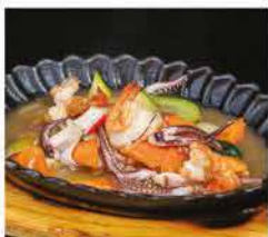
229. FRUTTI DI MARE* CON VERDURE ALLA PIASTRA € 10,00