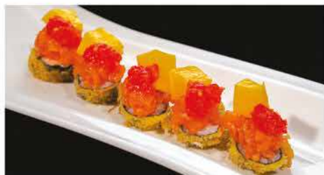
70. HOSOMAKI ESOTIC € 8,00 rotolino fritto con salmone, crunch, maionese, mango, pomodoro e salsa di frutta esotica