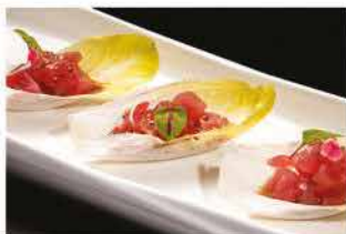
404. TONNO ALLE FOGLIE € 8,00 tonno, cipollini e salsa frutta