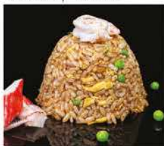
177. RISO CON PESCE ALLA GIAPPONESE € 8,00 riso bianco saltato con uova, verdure, pesce misto* e salsa giapponese di soia