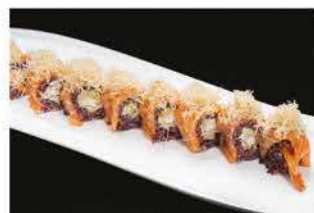
108. URAMAKI TIGER KATAIFI € 12,00 gamberi* fritti, philadelphia, salmone e pasta kataifi