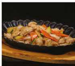
227. POLLO CON VERDURE ALLA PIASTRA € 8,00