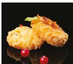
7. KOROKKE* 2PZ € 6,00 crocchetta di patate giapponese, surimi di granchio e cipolla