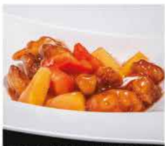
201. MAIALE IN SALSA AGRODOLCE € 6,00