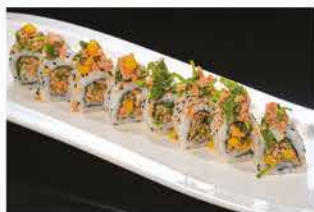
96. TONNO COTTO € 10,00 tonno cotto, polpa di granchio*, rucola e maionese