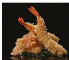
214. TEMPURA DI GAMBERI* E VERDURE € 10,00