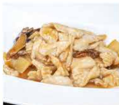
195. POLLO CON FUNGHI E BAMBÙ € 6,00