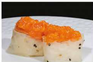
133. GUNKAN SOY SALMONE € 4,00 pallina di riso avvolto con foglia di soia e sesamo con spicy salmone