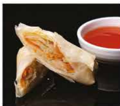
1. INVOLTINO PRIMAVERA* 1PZ € 2,00 involtino di verdure