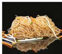
180. SPAGHETTI DI RISO CON VERDURE € 6,00