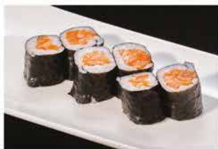
61. HOSOMAKI SAKE € 4,00 salmone