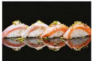
127. NIGHIRI SPECIAL 4PZ € 8,00 salmone alla fiamma con salsa di latte e pistacchio