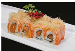
85. CRAZY SALMONE € 12,00 spicy salmone interno, avvolto da salmone scottato e kataifi esterno