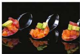
46. TARTARE MIX 3 CUCCHIAIO € 10,00 tartar di pesce mix e avocado con salsa ponzu