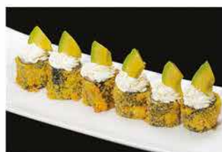
68. HOSOMAKI FRITTO AVOCADO € 8,00 salmone, philadelphia e avocado