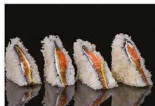
80. TRAMEZZINI DI SALMONE 4PZ € 8,00 tramezzini di sushi con salmone, philadelphia, avocado e scaglie di tempura