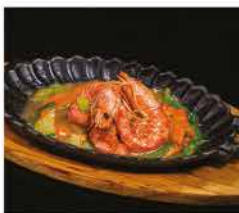
228. GAMBERONI* CON VERDURE ALLA PIASTRA € 10,00