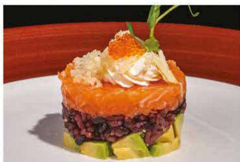
48. TARTAR NERO BURGER € 10,00 tartar di salmone con riso venere, avocado, scaglie di tempura, philadelphia, tobiko e salsa mango