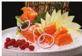
154. SASHIMI SAKE € 10,00 salmone 9 fette