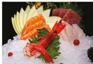
156. SASHIMI MISTO € 12,00 salmone, tonno, branzino e gambero* rosso (10 fette)