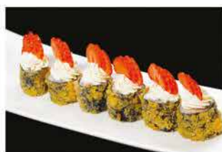
67. HOSOMAKI FRAGOLA € 8,00 salmone, philadelphia e fragola