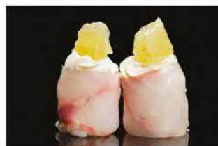
137. GUNKAN SUZUKI € 5,00 pallina di riso avvolto con branzino, philadelphia e lime