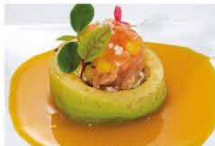
308. KANPAI STILE € 10,00

philadelphia, salmone, salsa avocado, ikura e salsa mango