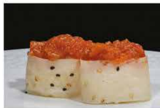
134. GUNKAN SOY TUNA € 5,00 pallina di riso avvolto con foglia di soia e sesamo con spicy tonno