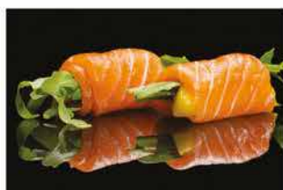
410. INVOLTINI SALMONE MANGO € 5,00 involtino di salmone con rucola e mango