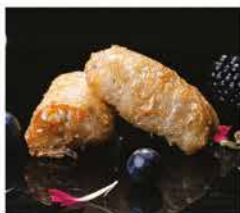
3. INVOLTINI VIETNAMITI* 2PZ € 3,00 involtino di verdure e carne