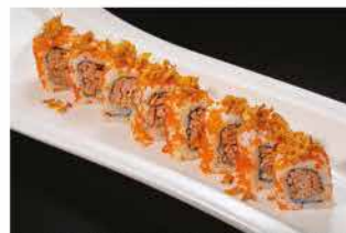
99. TONNO COTTO SPECIALE € 10,00 tonno cotto, maionese, salsa teriyaki, polpa di granchio* e cipolla secca