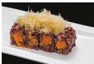
102. SPICY SALMONE VENERE € 12,00 tritato di salmone piccante e pasta kataifi

ROTOLO CON RISO VENERE CREATIVO DELLO CHEF 8 PZ