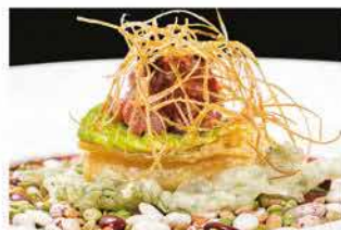
309. UOVA ALLA SALSICCIA PIEMONTESE € 12,00

avocado, philadelphia, zucchero di canna, salmone, mango, salsa sesamo, ikura e cioccolato nero