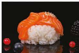
166. CHIRASHI SAKE € 10,00 salmone