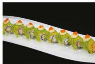
92. DRAGON € 12,00 gamberi* fritti e philadelphia avvolto con avocado