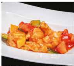
200. POLLO IN SALSA AGRODOLCE € 6,00