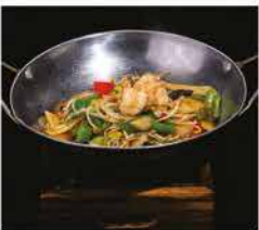
232. SCODELLA DI FUOCO AI GAMBERI* PICCANTE € 10,00 funghi, cipollotti, germogli di soia, peperoni piccante e gamberi