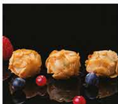
9. POLPETTE DI GAMBERI* € 6,00 gamberi, carne, cipolla, verdure, scaglie di mandorle fritte