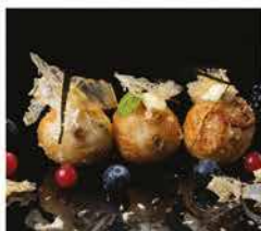
11. TAKOYAKI* € 6,00 polipo, patate, farina, maionese e scaglie di pesce essicato