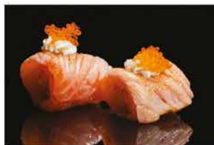
149. SALMONE ROLL € 6,00 tempura di gamberi* avvolto con salmone alla fiamma, philadelphia e tobiko