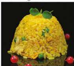
178. RISO CON POLLO AL CURRY € 8,00 riso bianco saltato con uova, pollo e curry