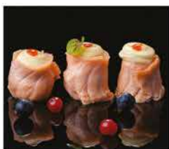
8. SAKE IMO YAKI 3PZ € 6,00 salmonne arrotolato con purè di patate e salsa teriyaki