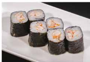
63. HOSOMAKI EBI € 4,00 gambero* cotto