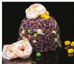
179. RISO VENERE CON GAMBERI € 8,00 riso venere saltato con uova, verdure e gamberi*