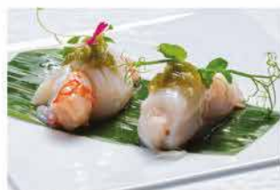
303. GUNKAN BIS PESCE € 10,00

ricciola, gamberi* rossi, toufu giapponese, burrata affumicata, salsa wasabi e wasabi fresco