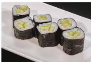
64. HOSOMAKI KAPPA € 4,00 cetrioli