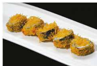
115. FUTOMAKI FRITTO € 12,00 salmone, avocado, philadelphia, tobiko e patate fritte