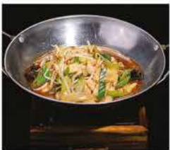
231. SCODELLA DI FUOCO DI POLLO PICCANTE € 10,00 funghi, cipollotti, germogli di soia, peperoni piccante e pollo