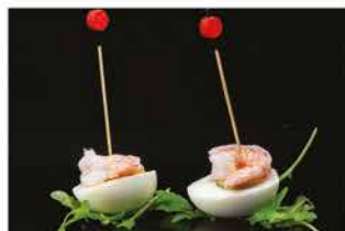
409. UOVA SODE € 6,00 uova, gamberi* e salsa