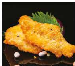
217. POLLO FRITTO € 8,00