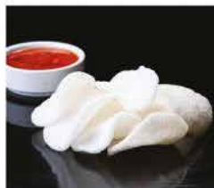
14. NUVOLETTE DI DRAGO € 3,00 patate di gamberi fritti