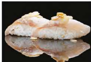
126. NIGHIRI SUZUKI COTTO € 4,00 branzino alla fiamma con salsa latte e mandorle