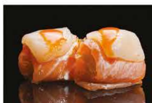
146. GUNKAN CAPELANTE € 6,00 gamberi* fritto avvolto con salmone alla fiamma, capesante, tobiko e salsa piccante