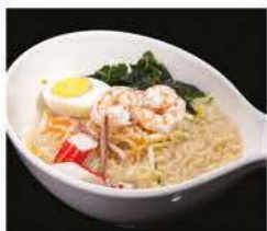
191. RAMEN CON FRUTTI DI MARE* IN BRODO € 10,00