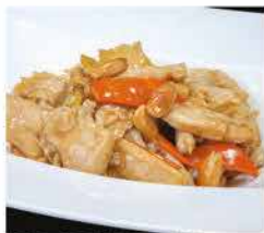
198. POLLO ALLE MANDORLE € 6,00