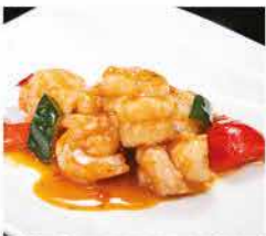
208. GAMBERI* IN SALSA PICCANTE € 8,00